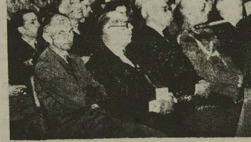
آقای علاء وزیر دربار پیام شاهانه را قرائت نمود

و تخریب در باره ام شاه را قرائت نمود و تقبل نخست وزیری و نایب رئیس جمعیت ایرانی طرفدار سازمان ملل متحد و رئیس دانشکده حقوق ایاتانی ایران گرداند پیام رئیس جمعیت فی که از نیورگ فرستاده شده بود خوانده شد