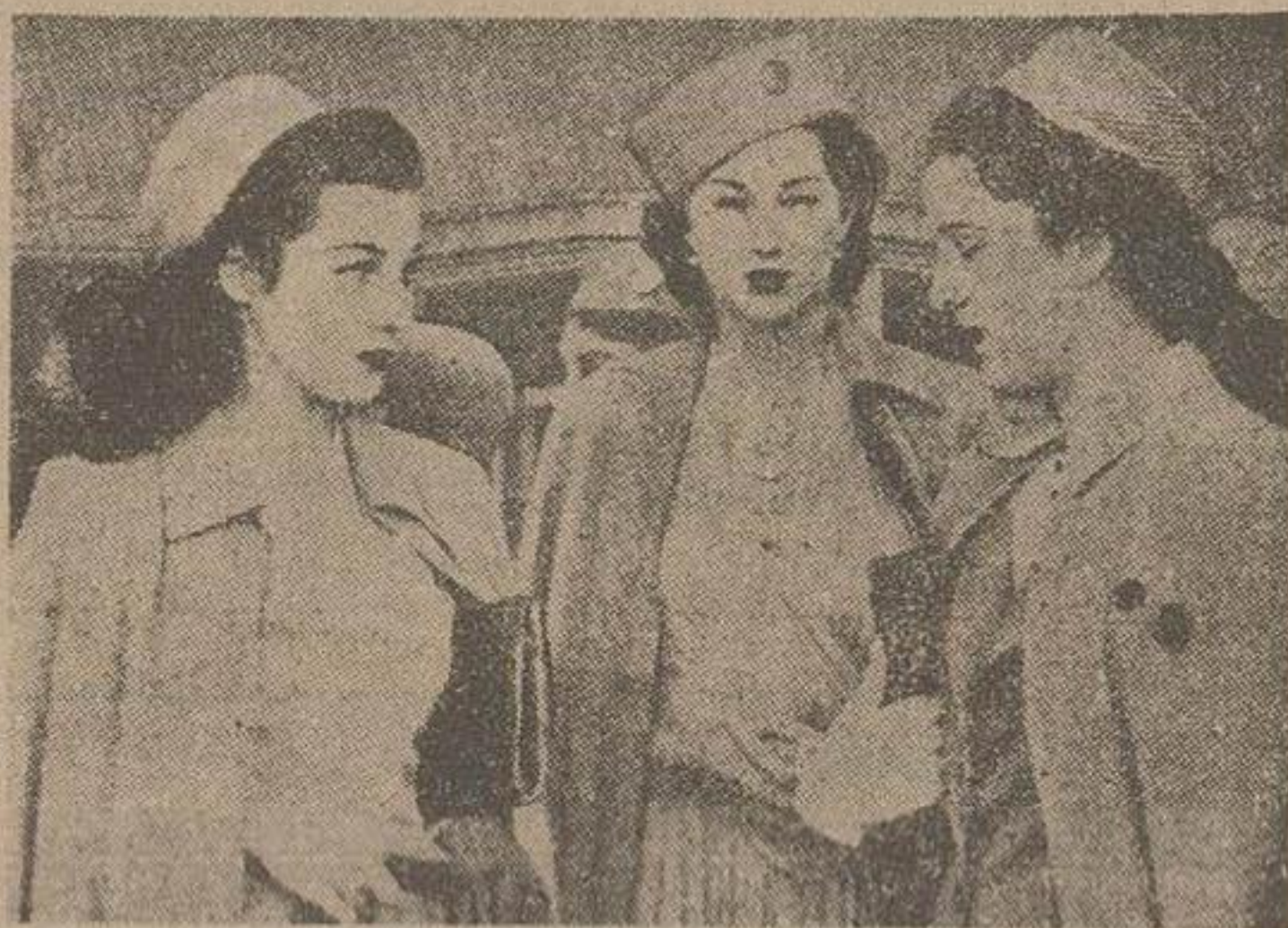
شاهدخت فوزیه و ملکه ساقی مصر و یکی از بانوان درباری

نحاس پاشا رهبر حزب وفاد، پس از مذاکره تلفنی با قاهره امروز از ژنو عازم کشور مصر گردید. کلیه نمایندگان خارجی مقیم در قاهره و طبقه دارند استوار نامه های جدید خود را با قید جمله «ملک فؤاد دوم پادشاه مصر و سودان» تقدیم شورای سلطنتی کنند - ظفراله خان وزیر خارجه پاکستان از اینکه تحول مصر بدون وقوع انقلاب توام با خونریزی صورت گرفته، اظهار خوشوقتی کرد. روزنامه های مصر، پانزده ساعت بعد از حرکت فاروق از اسکندریه، جریان عزیمت او را نوشتند بدستور ژنرال جیب پاشا عامل کودتای مصر؛ نواختن سرود ملی برای ملک فاروق از این بعد ممنوع خواهد بود - اظهار تاسف ملکه نازلی جریان مشروح علت کودتای مصر و حوادث چند روز اخیر