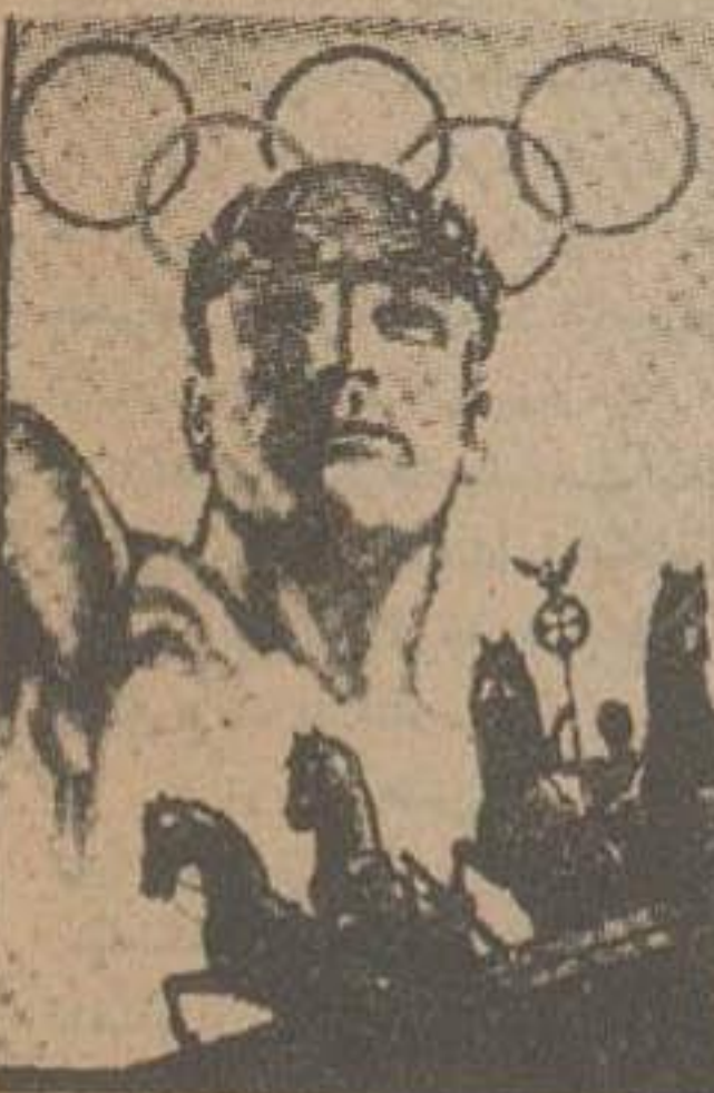
بقیه در صفحه پنجم

مسابقات بوکس از امروز آغاز شده است. دوندی که همه را غرق حیرت بقیه در صفحه پنجم