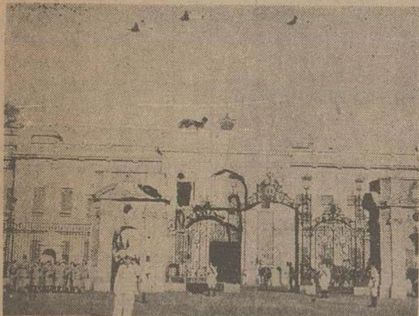
قصر عابدین در محاصره سربازان، ضمن پرواز هواپیما های جنگی

لیبون - خبر بزاری فرانسه - بر اثر طوفان بسیار شدید و بی سابقه ای که امروز در نزدیکی لیبون پایتخت برقرار رویداد عده ای کشته و جمیع زیادی زخمی و چندین کلبه و خانه نابود گردید. بقرار اطلاع چند نفر از درباری زدی شده و دردم فوت کردند. اخبار واصله از برقرار حاکمیت که تا بحال اینگونه طوفان در آن کشور سابقه نداشته است.