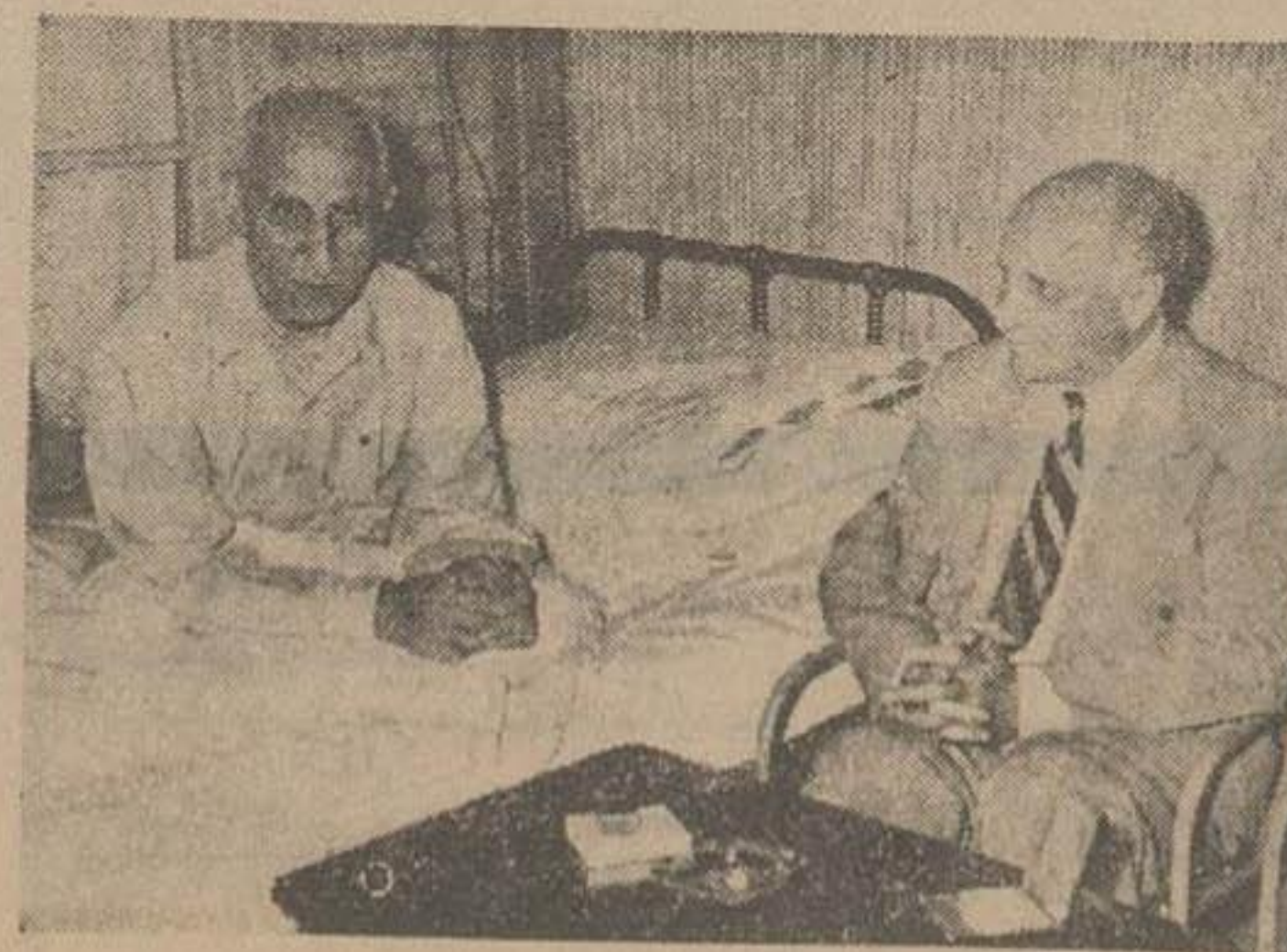
ملاقات میدلتون کرد در سفارت انگلیس با آقای نخست وزیر

برای خریداری ساختمان بانک واقع در میدان سپه تاکنون مشتری ثابتی پیدا نشده و بانک ملی هم تاکنون جواب مثبت برای خرید ساختمان بانک نداده است بنابراین اکنون بانک حاضر شده ساختمان خود را بهر کسی که مایل بخردی آن باشد فروشد و چون قیمت ساختمان مزبور نسبتا زیاد است بانک حاضر شده آنرا با تحصیل اطمینان با تساطب فروشد. بدین ترتیب بانک شاهنشاهی پس از ۶۳ سال عملیات بانکی در ایران پس فردا تعطیل و بربچیده خواهد شد.