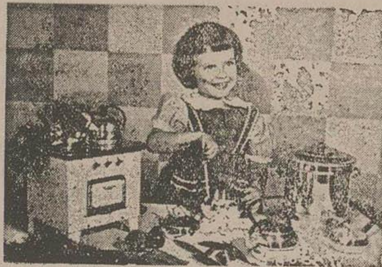
کوچولوی خانه دار

قرن ششم در هندو باستان پریده و جزو یادها شده بود چند شب قبل در مجلسی عروسی یکی اردوستان مشترک خود پرتو تواجی او را خانی ددم و علت را پرسیدم گفتند هر ضا است روز بعد میا در رفته گفت «من مرض نبودم اما چون لباس نقدتمت تمارض کردم و نیامدم، بعدسر در دوش از شد و بلختر تا آنکه شش در جا که شوهرش بر اثر مسافرت بارو با مبلغ سی هزار تومان مقروض شده و برای پرداخت اصل و فرع آن باید با ما هم رسید تومان زندگی کنند بعد در حالیکه قطره اشکی از گوشه چشمش پگونه میلفزید اضافه کرد متأسفانه کورتا نتیجه نداد و تا چند ماه دیگر سفر خواهد شد