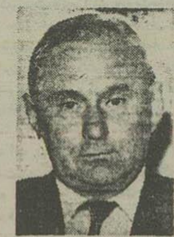
مراسم آشنائی و معارفه آقای فییر با وزه بیگ کاردیچیک رئیس جدید اداره بازگانی شوروی با آقایان وزیر اقتصاد و معاون وزارت امور خارجه امروز انجام گرفت.

امروز با وزیر اقتصاد و معاون وزارت خارجه آشنا شد