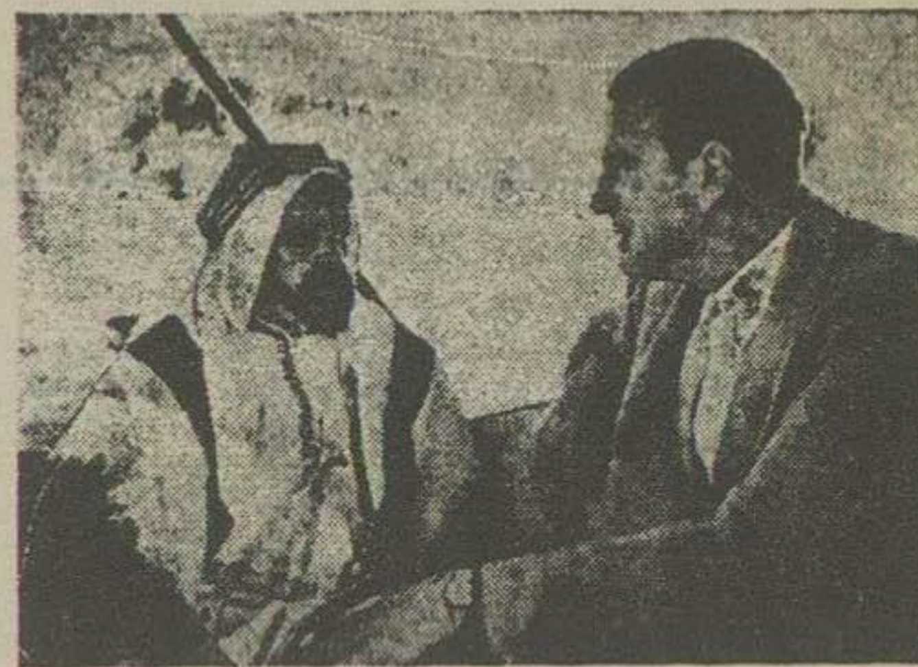
بلگریو و شیخ بحرین

تمام کرده باشد برای خدمت در یکی از کشورهای شرقی یا از میثاق... مستشاری حمد بن عیسی شیخ بحرین میباشد... بحرین جزء یکی از جزیره بود که در کرانه‌های عربستان تحت الحمایه... انگلیس بود ولی تا آنروز نام این جزیره مکتوب بلگریو تصور شده بود... حقوق پیشیندهای کاملاً برای از دواج کافی بود و از این رو این پیشیندها را پذیرفت... بلگریو و تازه عروس در مارس ۱۹۲۶ به «منامه» شیخ نشین بحرین وارد... شدند ولی برخلاف انتظار این محل را سوار نامناسب و غیر قابل زندگی یافتند... در این شهر حتی آب آشامیدنی از خارج با کشتی وارد و وسیله مشک در کوچهای... کثیف به مردم توزیع می‌شد.