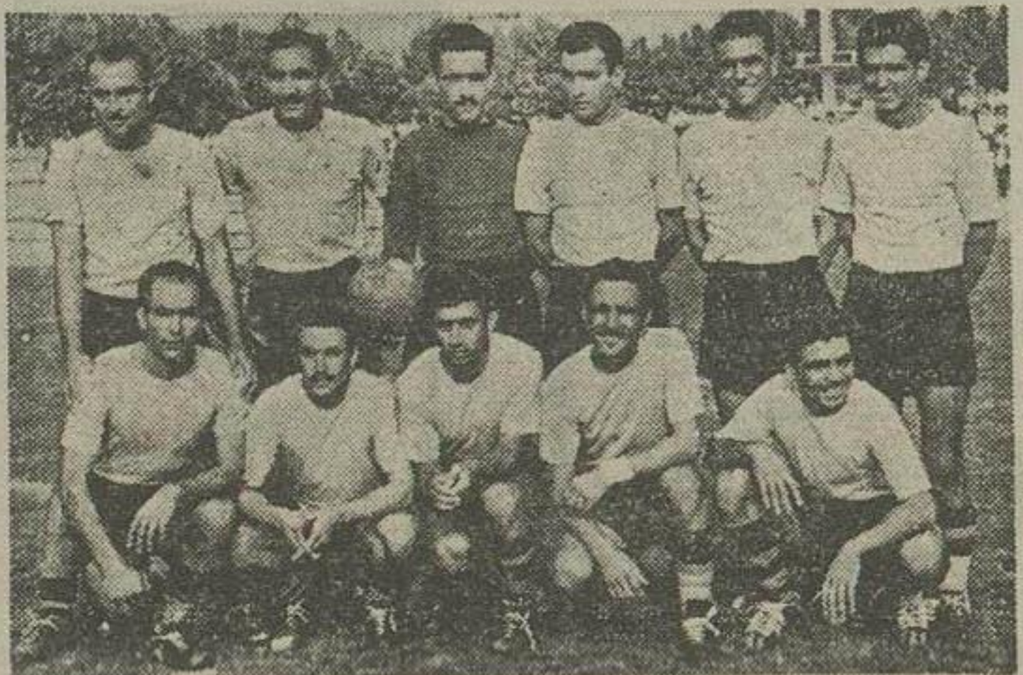
در این عکس بازیکنان تیم فوتبال تاج قهرمان مسابقات دو حذقی باشگاههای تهران دیده میشوند

مقران ساعت ۵ بعد از ظهر دیروز عده کثیری از علاقمندان فوتبال که به بالغ بر هشت هزار نفر میشدند برای تماشا مسابقه نهائی فوتبال دو حذقی باشگاهها در میدان امجدیه گرد آمده بودند. این اجتماع اهمیت مسابقه فوتبال را که بهترین بازی سال محسوب میشد مرسا نید مخصوص کوروشکاران باشگاههای تاج و شاهین برای پنجمین بار مرتباً با یکدیگر روبرو میشدند. دست ساعت ۵ بعد از ظهر کدو فوتبالست های شاهین و تاج در میان امرا از احساسات تماشاچیان وارد و محو و زمین چمن شدند.