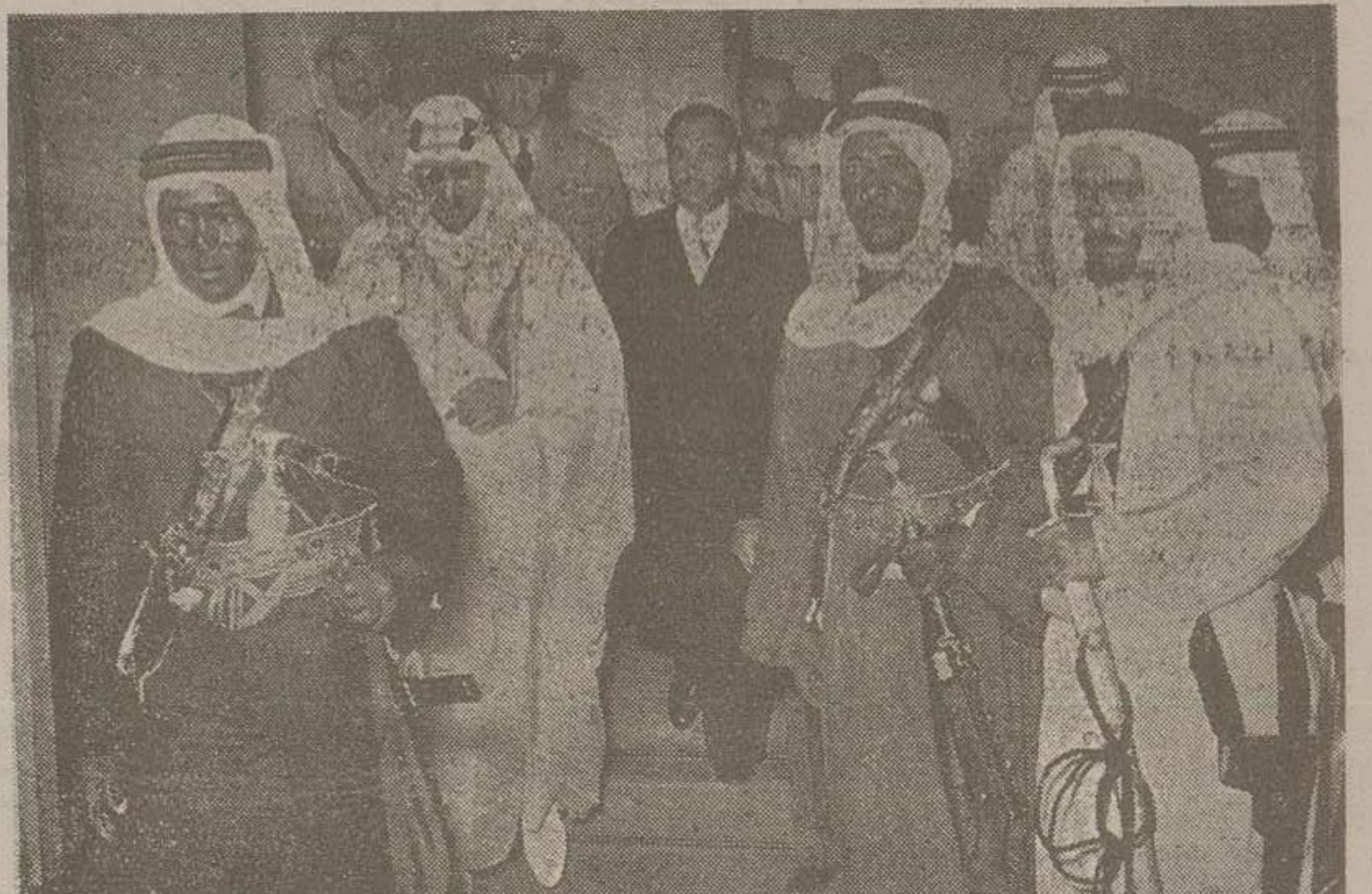
ملک سعود و محافظین وی در مدخل آرامگاه اعلیحضرت فقید

از دیروز که اعلیحضرت ملک سعود وارد تهران شده اند طبق برنامه رسمی بدرستی از مظالم و همراهمان نشان از ظهر دیروز آغاز شده است. همانطور که دیروز اطلاع دادیم اعلیحضرت ملک سعود ناهارا دیروز باشاهنشاه صرف فرمودند و سپس برای بقیه در صفحه درازدهم