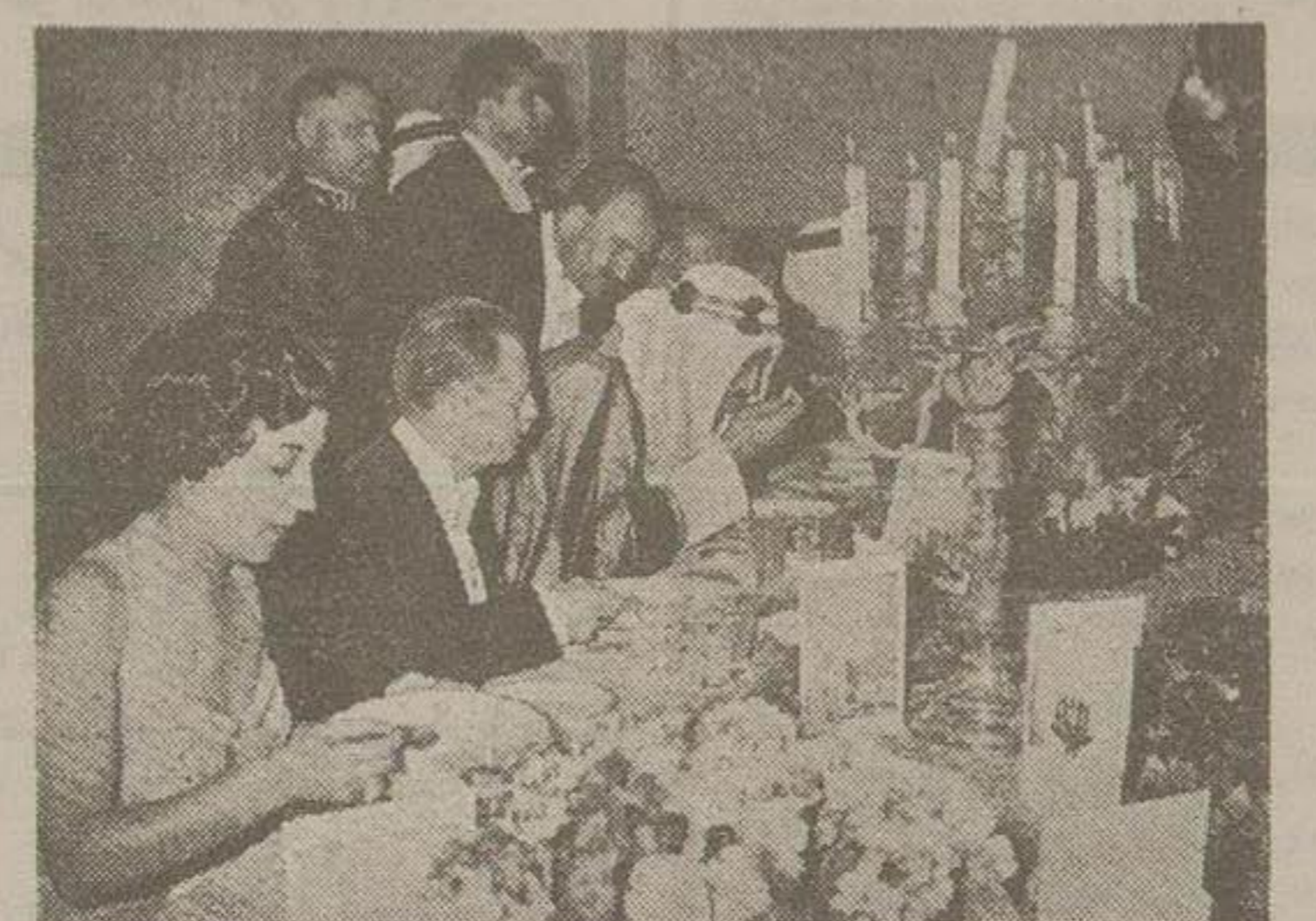
اعلیحضرت ملک سعود و آقای نخست وزیر در سرمیوشام در باشگاه افسران

چند گامه از گذشته ها اکنون بیش از ۲۵ سال از هنگامی که معاهده ترکمانچای بین ایران و روسیه تزاری بسته شد میگذرد. در این مدت برای مرزهای بین دو کشور حدود طبیعی از قبیل رودخانه ها و کوهها تعیین شده بود و بالطبع هر يك از طرفین می توانست بیخود خود تجاوزاتی بکند. قبل از اینکه حکومتک روسیه ایستی شوروی تشکیل شود و پیش از سلطنت اعلیحضرت فقید برای عبور از مرزها در شمال ایران مقررات خاصی وجود نداشت، بسیاری از سائین روسیه برای تجارت با ایران می آمدند و فقط بازر بافت یک دوره کم کم مدتها در خاک ماقامت می کردند. گاهی نیز مالکین شمال سنطور قریح یاد دوسته از مرز عبور می نمودند