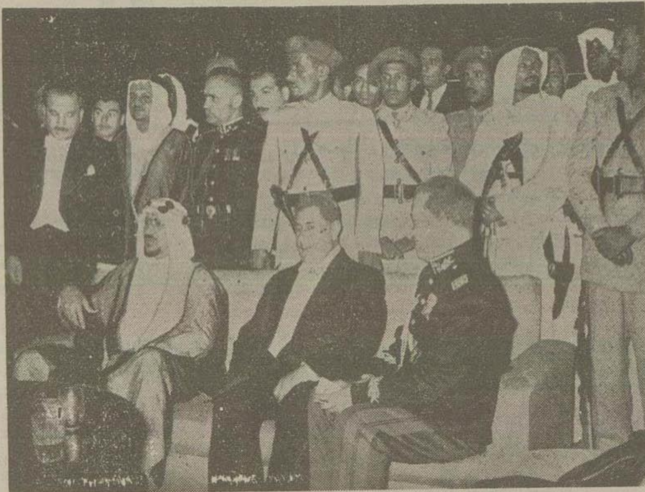
علیهضرت ملک سعود و آقایان وزیر جنگ و رئیس مجلس شورای ملی در ضیافت دشب

استراحت یکساعته صاحبقرانیه رفتند و رتانه دیبش علیهضرت و همراهان شرکت در ضیافت تیسار وزیر جنگ در باشگاه افسران بود و امروز نیز اجرای برنامه ادامه داشت و گزارش خبر نگار ما از مراسم دشب و مراسم روز از این قرار است: دشب باانتظار علیهضرت ملک سعود در باشگاه افسران مراسم یکساعته برگزار شد یکساعت در سر میز شام کمباز نخست وزیر و وزیران و روسای نمایندگی کشورهای اسلامی و چندتن از رجال و افسران عالی مقام با بانوان خود شرکت داشتند و در حضور پادشاه و شاهزادگان کشور سعودی صرف شام نمودند آقای وزیر جنگ در سر میز شام لطفی باین شرح ایراد نمود بنده اقتضای مراسم که بنام ارتش شاهنشاهی از تشریف فرمائی علیهضرت ملک سعود باشگاه افسران که آنرا بنام خانه افسران مینامیم تشکر و انتقاد کم.