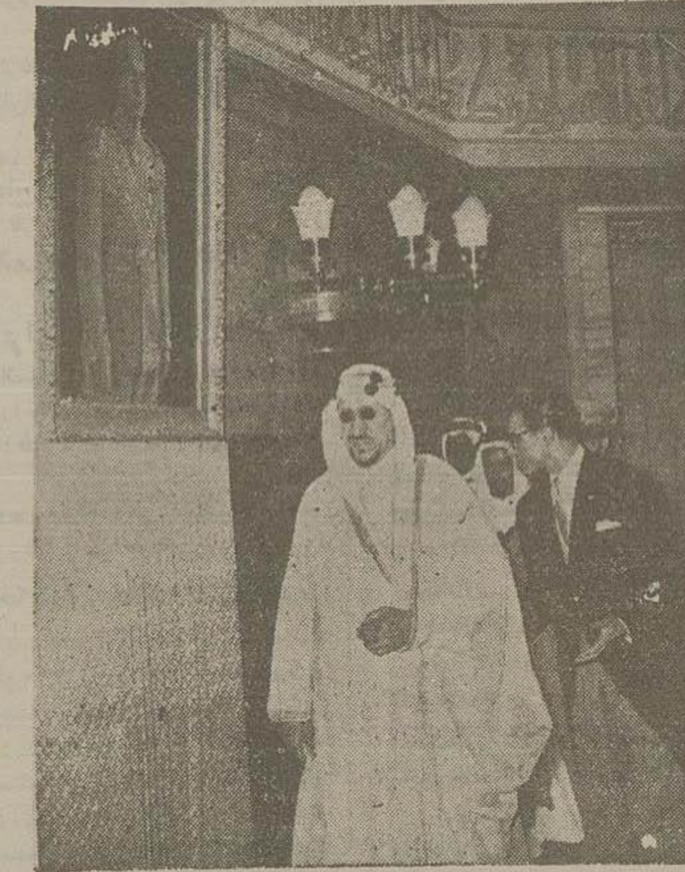
والاحضرت شاهپور عبدالرضا پادشاه سعودی هنگام گردش در قسمت داخلی آرامگاه

پس از آنکه علیهضرت ملک سعود در سر میز شام اظهار داشتند که ما در اینجا صرف ناهار میفرمایند و امید است روابط صمیمیت و هلاق ممتوی بین دو کشور دوست و همکیش روز بروز قوی تر گردد.