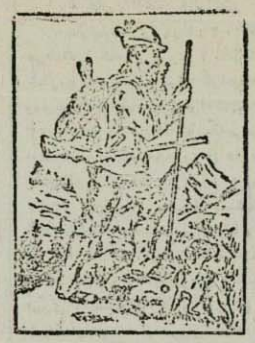
هدیه صلح بازرگانی مرعشی

مردم ایران از اوصیه - استندارتند شاید کثیر خاندان را در این شرو پندارند که یک یا چند نفر از آنان