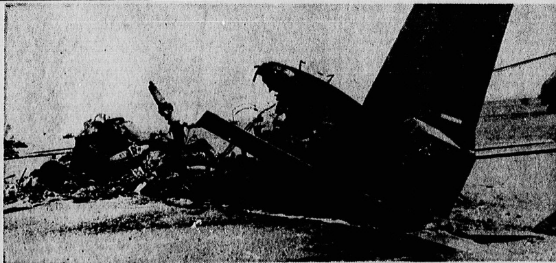
لشنه هواپیمای سی-۱۳۰ امریکایی که قسمت اعظم آن بهنگی سوخته است.