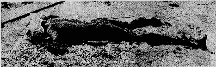
جسد زنگشده يك ناخداگر دریائی كه قربانی جبه طلیی های ضدبشری كارترو شده است.