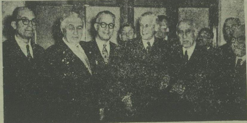
در جلسه دیروز که چهار ساعت بطول انجامید و شرح آن در مطالعه خواهد نمود آقای نخست‌وزیر آغاز مذاکرات را با امید نیل به حسن نتیجه استقبال نمود. عکس بلاادیت از جلسه نمایندگان بانک و نخست‌وزیر و اعضای کمیسیون برداشته شده است.