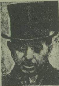
نوری سعید پاشا

دادبویاریس - مذاکرات مستر کارنر معاون بانک بین‌المللی با دکتر مصدق راجع با اداره صنعت نفت ادامه دارد. میان این دو نفر راجع بدو مسئله اختلاف نظر وجود دارد. اول اینکه بانک میخواهد قیمت نفت را بر اساس بهای خلیج فارس حساب کند در صورتیکه این قیمت بواسطه کسر شدن میزان کرباه از بهای خلیج مکزیک که نرخ بین‌المللی است، خیلی پایین تر است و دکتر مصدق تقاضا میکند که همان قیمت خلیج مکزیک ماخذ قرارداد شود. اختلاف دیگر راجع بقضی است که بانک باید بازی کند. آیا بانک نماینده دو طرف (ایران و انگلیس) خواهد بود و یا اینکه مانند بک دلال واسطه معاملات خواهد بود و بر