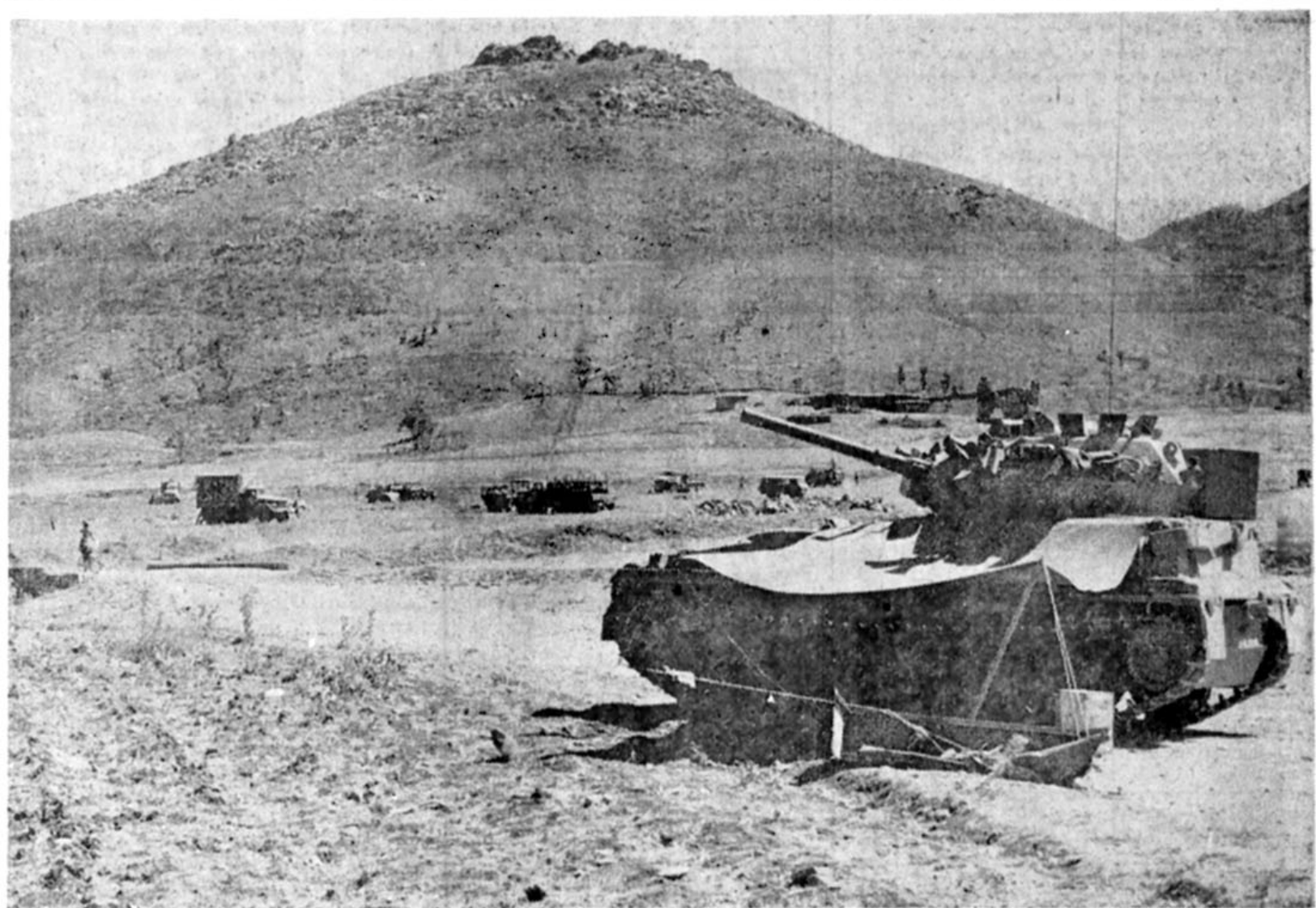
* همه جا تحت کنترل است کلبه مناطق سوق الجیشی در کردستان، اکنون تحت کنترل ارتش درآمده است ، عکس ، محاصره تپه ای در بانه را نشان می دهد.

● مردم بیایند از ما سوال کنند آقا این چیزی که در حساب صد ریخته شد ، خوردید یا عمل کردید در صفحه ۲