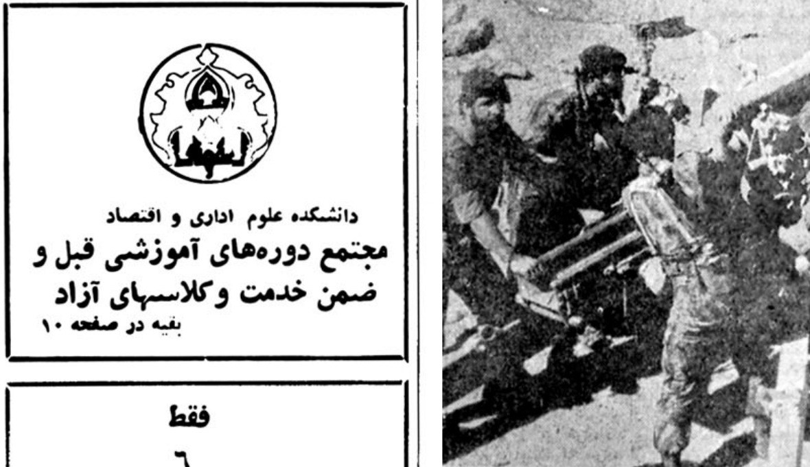
* استقرار توپ بیش از آنکه گردنه «خان» به تصرف ارتش درآید ، قوای نظامی مواضعی را که ممکن بود مهاجمان از آن طریق ، حمله کنند ، به تصرف درآوردند.

در نقاط دیگر خبرنگاران ما گزارش های پراکنده ای از نقاط مختلف کردستان فرستاده اند ، که در زیر می خوانید : پس از تصرف مهاباد توسط افراد ارتش جمهوری اسلامی ایران ، پاسداران اعزامی از منطقه ۱۲ اصفهان و سنندج ، وارد این شهر شدند . همین گزارش حاکی است ، پاسداران هنگام ورود ، همزمان با پاکسازی تپه های مشرف به شهر ، توسط گروه های کلاه سبز ، عده ای را در حال فرار ، تعقیب و ۱۵ نفر را که از اعضای حزب دموکرات هستند ، دستگیر کردند . در بازرسی از محل سکونت این عده ، دو قبضه فشنگ ، قبضه کلت ، تعدادی فشنگ ، نارنجک جنگی و تعداد زیادی اعلامیه های مختلف از شیخ عزالدین حسین و سازمان