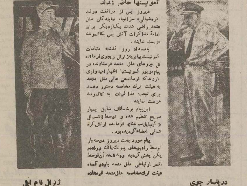
ژنرال نام ایل فرمانده ارتش کره شمالی

ژنرال کیم ایل سونگ فرمانده ارتش کره شمالی دیروز نامداد نمایندگان ملل متحد را دعوت کرد برای ادامه مذاکرات بشهر کانسون پوند این بار هم نتیجه مذاکرات پوچ بود