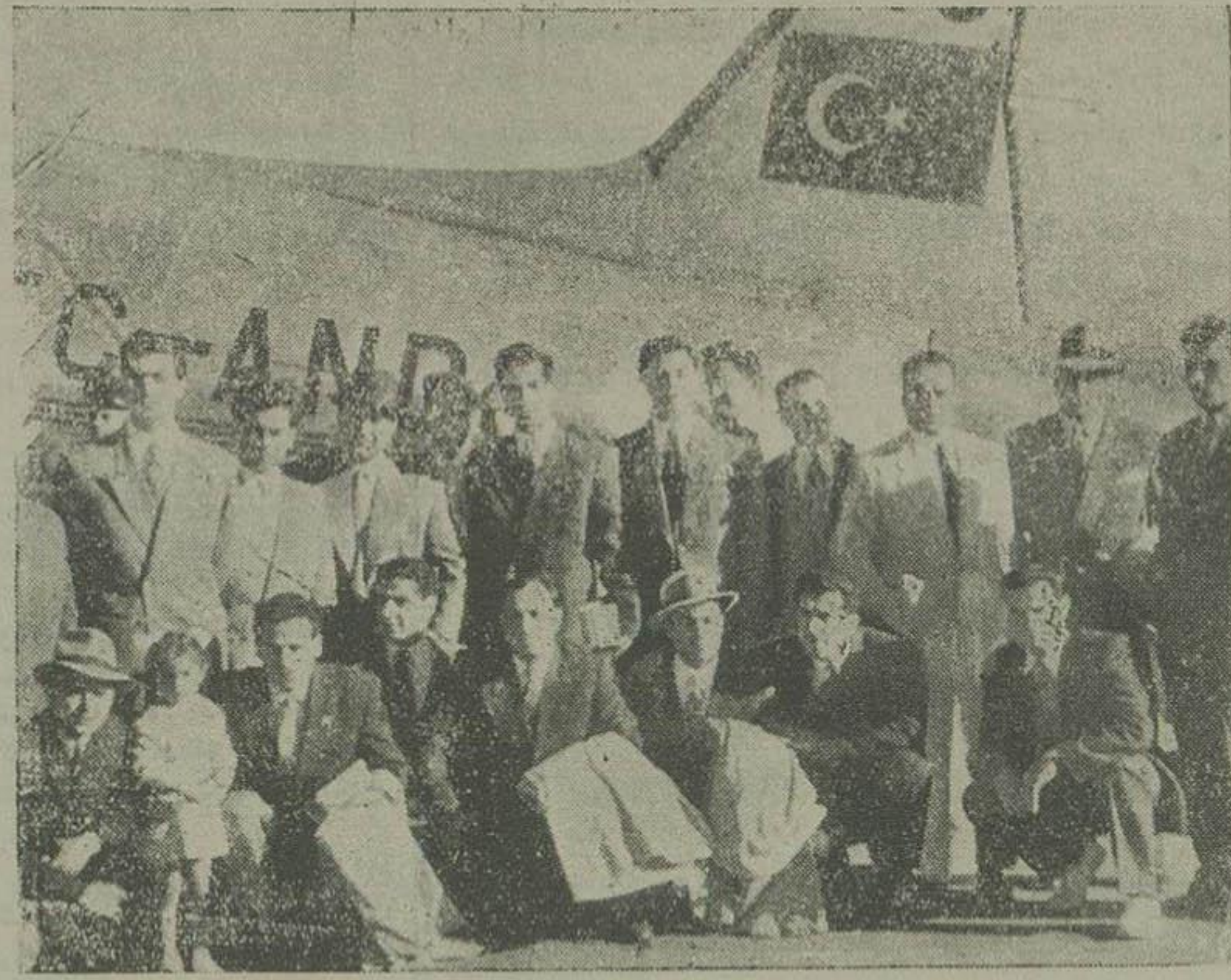
اعضای تیم ملی ایران و تیم تهران ، هنگام حرکت به سمت ترکیه

ساعت ۶ و نیم بامداد بود که با اتومبیل خود را بفرودگاه مهرآباد رساندم و انتظار داشتم محوطه فرودگاه از ورزشکاران پر باشد و دسته دل های فراوانی هم برای تشریف فرمایان جوان با استعداد ماهر آمده باشند.