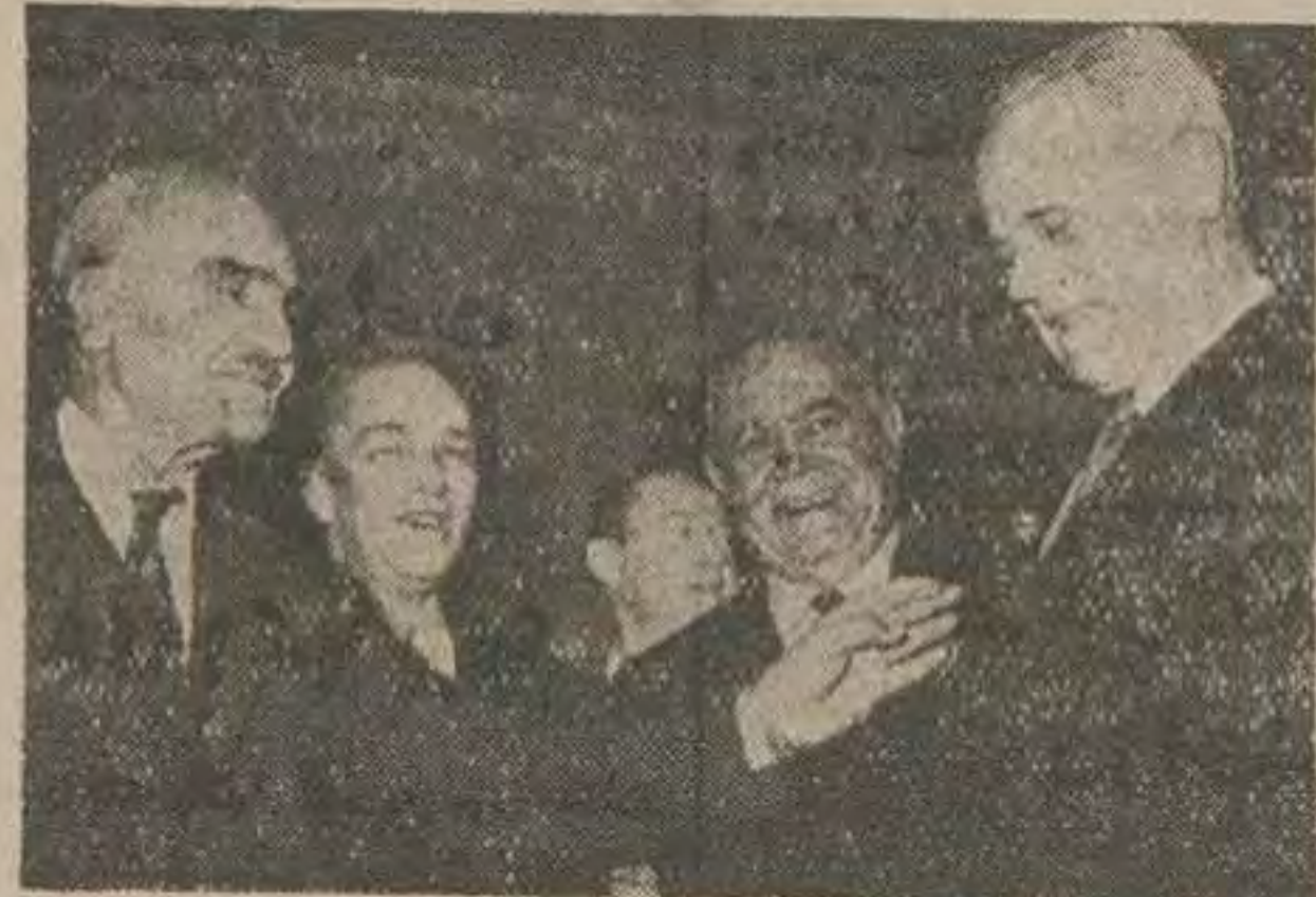
دریافت سفارت شوروی رتیر هت نمایندگی شوروی رئیس مجلس سنا صحبت می کند

صنعتگران ایرانی باید سعی کنند از این فرصت به خوبی استفاده کنند. محصولات صنعتی خود را عرضه کنند.