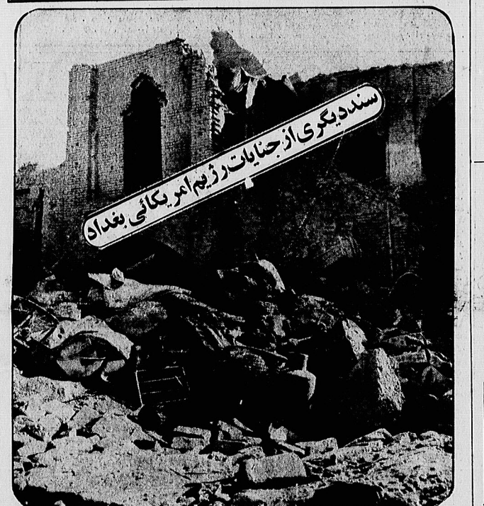
سند دیگری از جنایات رژیم امریکائی بغداد

نیروی دریایی ایران راه ورود و خروج کشتی ها به بنادر عراق را مسدود کرده است کشتیرانی در خلیج فارس و تنگه هرمز را تضمین شده اعلام میکنیم در صورتی که شرایط ایجاد کند به مین گذاری تنگه هرمز و خلیج فارس اقدام می کنیم با شواهدی در دست است که هواپیما های آواکس آمریکا به دشمن ما اطلاعات جنگی رد کرده اند در صفحه ۲