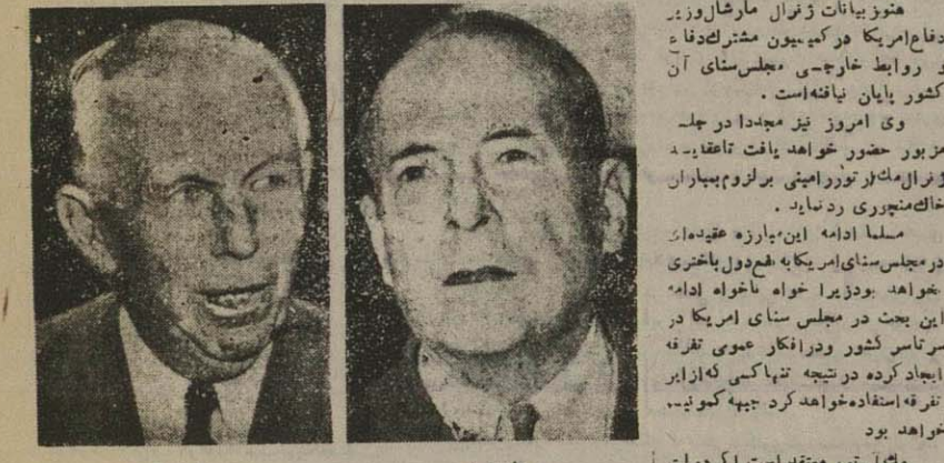
مارشال مغالط بپاران