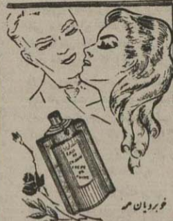
فوریان مراد و گن شتر صرف کی گن

من میگویم که مسا باید برای ثبوت و حمایت مردان خود در کشور اقدام کنیم و با آنها را بخواه های خود بر گردانیم اما ما را بخدا این بیکار بی نتیجه و بدون هدف را که فقط مردان ما را بخاک هلاک می افکند ادامه ندهیم.