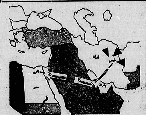
بر اساس گزارشهایی که تاکنون از سینه هواپیمای نظامی و تجاوز آنها به ایران پیوسته رسیده، صحنه نبره نواختن هواپیمای بالاباز به شکل بالاباز میسر. با احتمال زیاد، قاره حمل پرواز هواپیمای بود تو توجیه مقامات مصری و امریکائی بر این بود که هواپیمای از خاک مصر پرواز کردند، به بهانه نبره می رسد.

دیروز یکصد و نوازدهمین اعلامیه دانشجویان مسلمان پیرو خط امام صادر شد اخطار شدید دانشجویان مسلمان پیرو خط امام