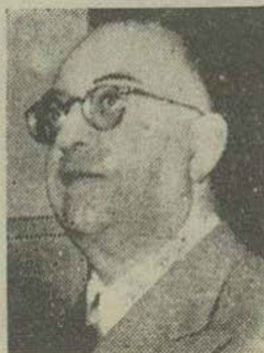
از روزیکه بودجه سال جاری منتشر شدوجه گریخته اتفاداتی در اطراف بقیه در صفحه هشتم

بقلم آقای حاج محمد نمازی تاثیر مالیتهای غیر مستقیم در قری هزینه زندگی