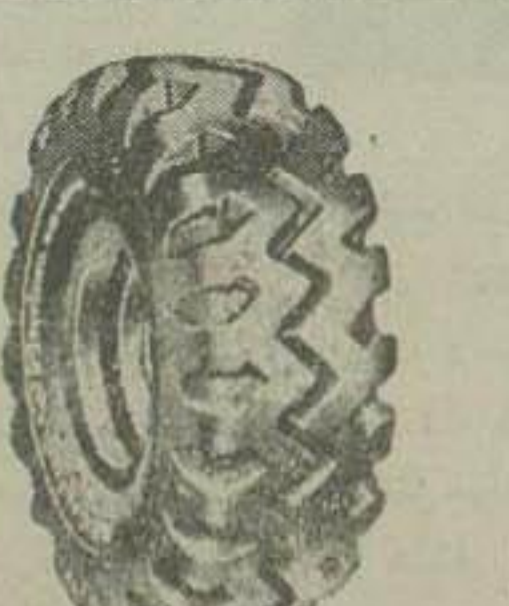
رولک اوگرند در سه نایون نماینده انحصاری در ایران شرکت سهامی شیدیز - خیابان سعدی ۷۰۵۸-آ

مدت یک هفته است که رطوبت هوا زیاد شده امروز به ۴۰ درجه رسیده از ساعت یک تا پنج بعد از ظهر هیچکس در خیابانها دیده نمیشود . بر اثر شدت گرماعده ای بیمار شده و ۶ نفر تلف شده اند .