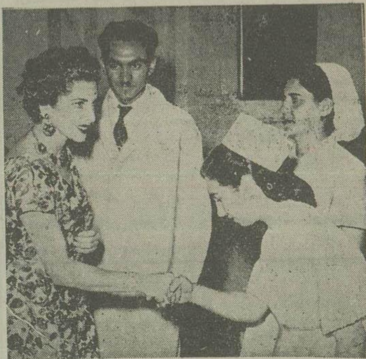
در عکس بالا والاحضرت شاهدخت شمس پهلوی هنگامیکه پرستاران را مورد تشویق قرار میدهند دیده میشوند.

چون در شب سادته سیل میگون پرستاران شروخورشید سرخ و همچنین ایکب اعزای طبی برای یک سبیل زدگان و رساندن خوراک و دارو فاصله بین شمس و میگون را که بر اثر سیل مسدود شده بود پیاده طی کرده و پس از طی چندین کیلومتر در میان کولولای دوساعت و نیم بعد از نیمه شب خود را بحلقه رسانده مجروحین را بانمان کردند و کسانی را که لازم بوده بیارستان امدادی شروخورشید سرخ منتقل نمودند.