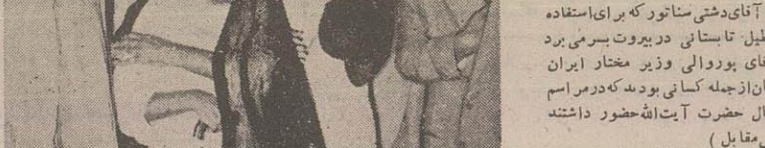
بطوریکه در عکس بالا دیده می شود از مقام جمعیت مستقلمین در فردگاه بیروت بحدی بود که بپس برحمت توانست راهی برای عبور حضرت آیت الله از میان جمعیت باز کند.