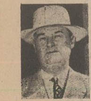
لندن - رویتر - محافل مطلع لندن امروز اظهار داشتند که مستر ویلیام آلتون جوینر رئیس شرکت نفت (سیتیز سرویس) امریکا که اخیرا بنا بدعوت آقای دکتر مصدق بایران سفر کرده و از پالستگاه آبادان و سایر مؤسسات نفت ایران بازدید نموده است ممکن است در مراجعت خود بامریکا بلندن نیز مسافرت نماید. مستر جوینر در ایران راچم بامکان احیاء صناعت نفت ایران مطالعاتی بعمل آورده و قراردادست نظریات خود را در این باره با نخست وزیر ایران در میان گذارد.

گزارشی که با چند عکس توسط خبرنگار ما از مسابقات بین المللی روکسل رسیده است فعالیت های نشت پرده ای که بای نفت ایران می شود نوکر و کلفت متحد شده و خانم خود را در آب انبار انداختند زیباترین و خوش لباس ترین نمایندگان مجلس را شناسند این قسمتی از مندرجات اطلاعات هفتگی است که پس فردا منتشر شود