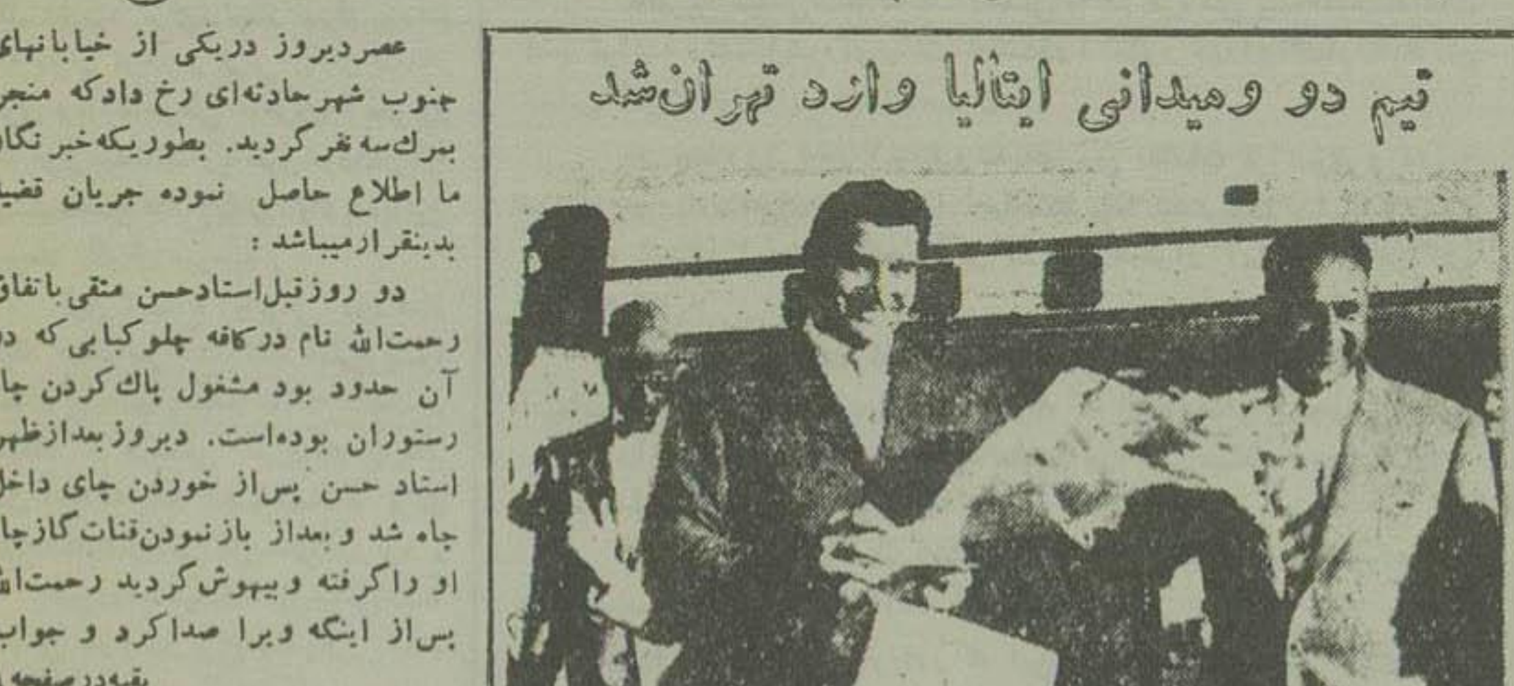
تیم دو و میدانی ایتالیا وارد تهران شدند

استاد حسن هنگام پاک کردن چاه بیهوش شد و دو نفر دیگر نیز که بکمک او رفتند یکی پس از دیگری خفه شدند و نفر دیگر بیمارستان بستری گردیدند جسد خفه شدگان امروز با استفاده از ماسک ضد گاز خارج شدند