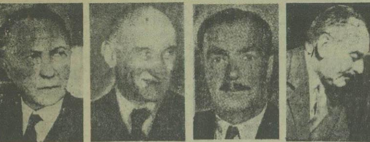
اچسن ایدن شومان ادنائر

دیروز عصر کنفرانس وزیران خارجه سه دولت در لندن تشکیل گردید انگلستان و امریکا از ضمانت امنیت فرانسه خودداری کردند