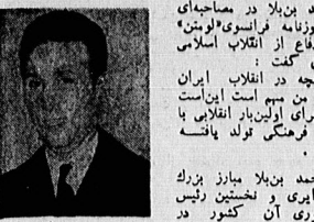
احمد بن بابا، در جریان حمله هوایی اسرائیل به لبنان...

تودیه، گروهی است که با طرح فرهنگی تودیه یافته است... (The text discusses the role of the Tudeh party in the Islamic Revolution.)