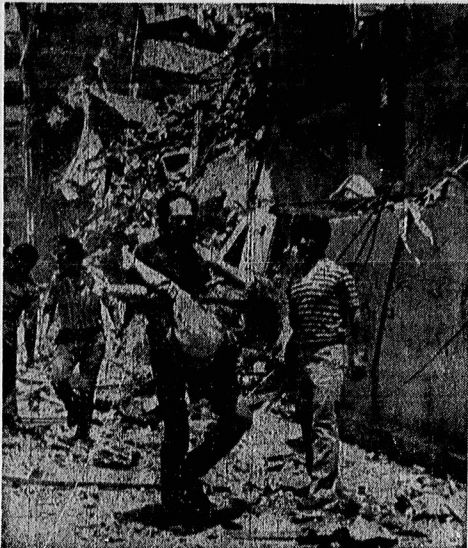
بیروت لبنان، ۳۱ تیر - آسوشیتدپرس، گروهی از بازماندگان فاجعه بمباران وحشیانه بیروت توسط هواپیماهای رژیم اشغالگر فلسطین، مجروحین و کشته شدگان حاد را از زیر آوار خارج می‌کنند.