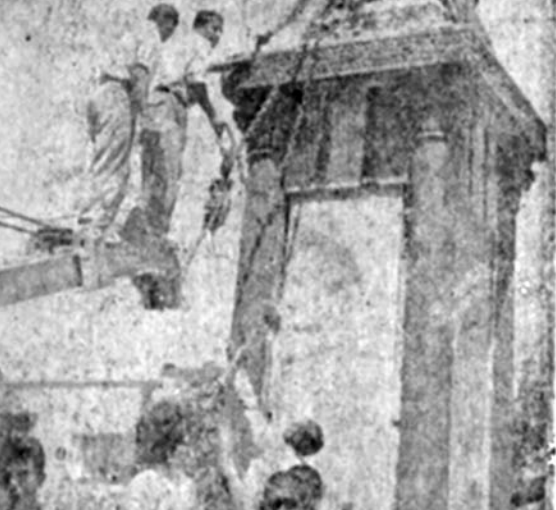
۲۵ روز ۲۵ مرداد، مردم خشمگین، مجسمه های محمد رضا و پدرش را در تهران و شهرستانها سرنگون کردند

مدارک ضمیمه بشرح ذیل میباشد: سه قطعه عکس ۳×۴ فوتوکپی شناسنامه از تمام صفحات فوتوکپی گواهی فراغت از تحصیل دوره متوسطه فوتوکپی وضع خدمت و طبقه عمومی فوتوکپی کارنامه آزمون سازمان سنجش آموزش کشور فیش بانکی بندره مبلغ یکپنجاه ریال به حساب جاری شماره ۹۰۰۳۷ بانک ملی شعبه انقلاب اسلامی (چهارم آبان سابق) - شماره فیش بانکی حتما بایستی قید شود. مالف ۸۴۳