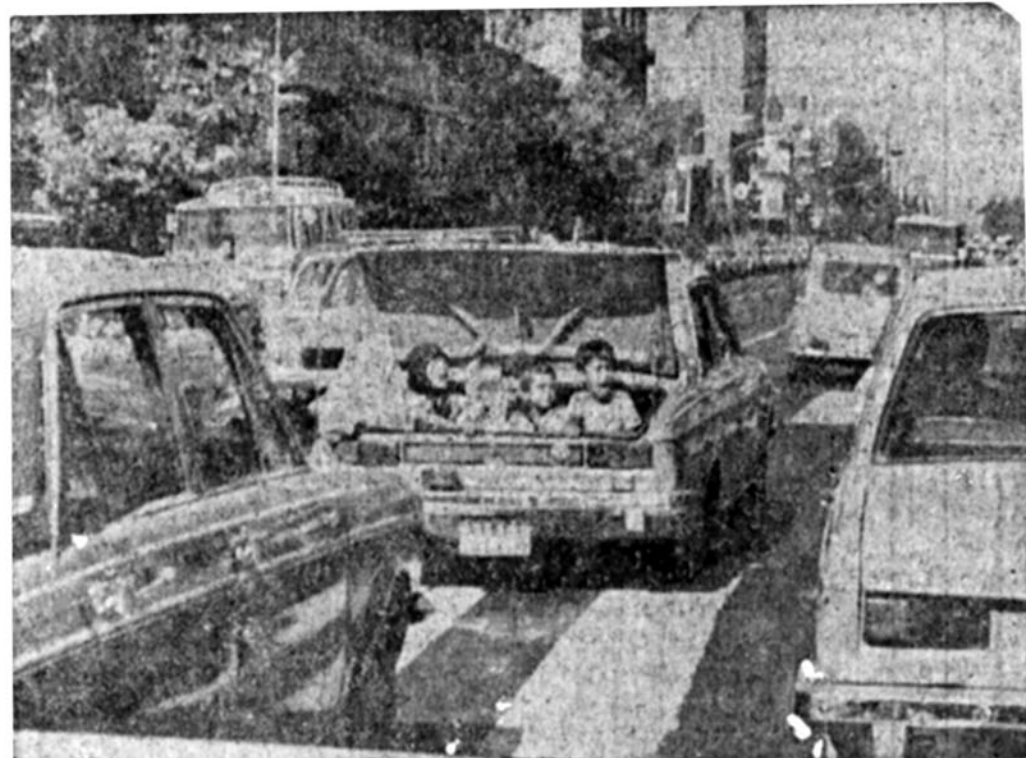
ثوره... ثوره حتی النصر

شرکت فعال زنان انقلابی ایران، در مراسم روز قدس، یادآور شرکت فعال آنان، در روزهای قبل از پیروزی انقلاب بود. زنانی که دیروز، در کنار جوانان رزمنده کوکبل مولوتف به دست می‌گرفتند و در کوچه پس‌کوچه‌های شهر، علیه استبداد و دژخیمان پهلوی می‌جنگیدند، دیروز بار دیگر با اجتماع یکپارچه خود در مراسم روز قدس، نشان دادند که همچنان هشیار و بیدار، در حفظ دستاورد های انقلاب ایران، پابرجا هستند مگر آنیوه زنان را در صحنه‌ها نشان می‌دهد.