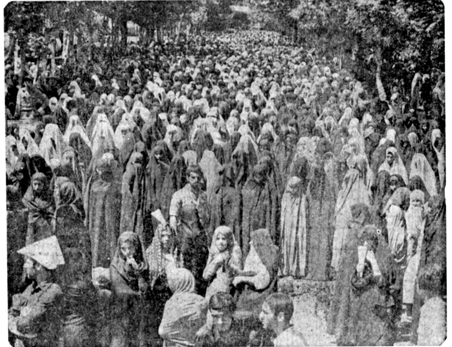
زن بیدار انقلابی

در میان جلوه‌های گوناگون راهپیمایی دیروز، تصویر بزرگ اسرائیل در دست یک جوان رزمنده، مردم را به هیجان آورده بود. بر این تصویر نوشته بودند: فلسطین پیروز است، اسرائیل نابود است؛ شعار واحدی که بیش از سی و نهم میلیون تهرانی و میلیون‌ها ایرانی دیگر را فریاد سرسبز قدس، در کنار هم جمع کرده بود.