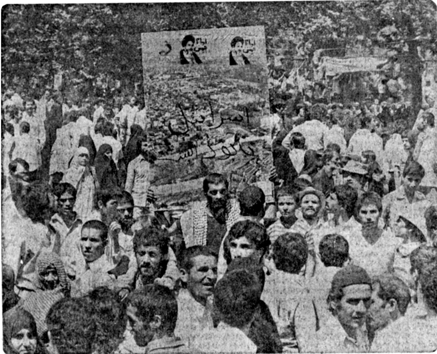
فلسطین پیروز است

و اشتباه اسرائیل غاصب همین بود که می‌پنداشت با ضب بیت‌المقدس تنها با ملت فلسطین طرف است، حال آنکه اینک جهان اسلام برای رهائی سرزمین قدس قیام کرده است. با امید آنکه هرچه زودتر شاهد پیروزی راه امام خمینی در بیت‌المقدس بجا آوریم.