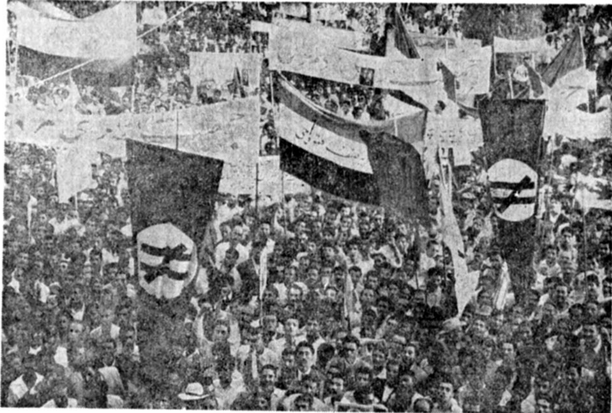
۲۸ مرداد، میدان بهارستان تهران، شاهد تظاهرات حق طلبانه مردم بود که با قاطعیت سرنوشتی رژیم شاهنشاهی و ختگی کردن توطئه‌های رژیم پهلوی را خواستار شدند.