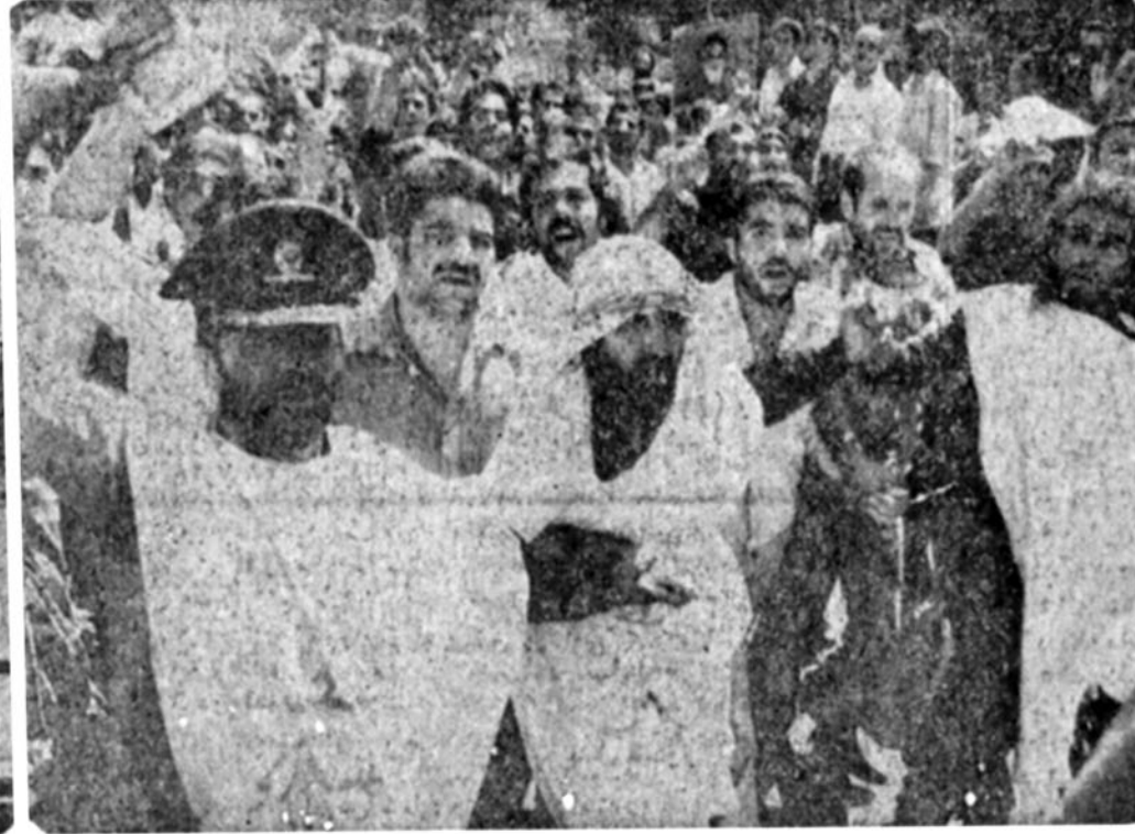
کفن پوشان جان برکف

انقلاب ..... انقلاب تا پیروزی. دیروز فضای تهران سرشار از این سرود بود. حتی بچه‌ها این سرود را می‌خواندند. بجهانی که بواضع بر بسودن آتاک انومیل تاگزیر در صندوق عقب نشسته بودند.