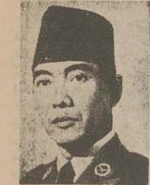
دکتر سوکارو رئیس جمهور اندونزی

معدس صلاح الدین پاشا وزیر امیر خارجه مصر در تمقیب و تقیر این اقدام حاکم انگلیسی سودان اظهار داشت که دولت مصر حکومت سودان را بر مسیت نفاذ شناخت اداره امور سودان که در قاهره بود هتفه گذشته بظیل تصد کتبه شب آن نیز در سایر قاصر بسته شده است آقای صلاح الدین پاشا سپس خاطر نشان کرد که انتحایات علی و قلعی در مورد سودان متجاوب شده است