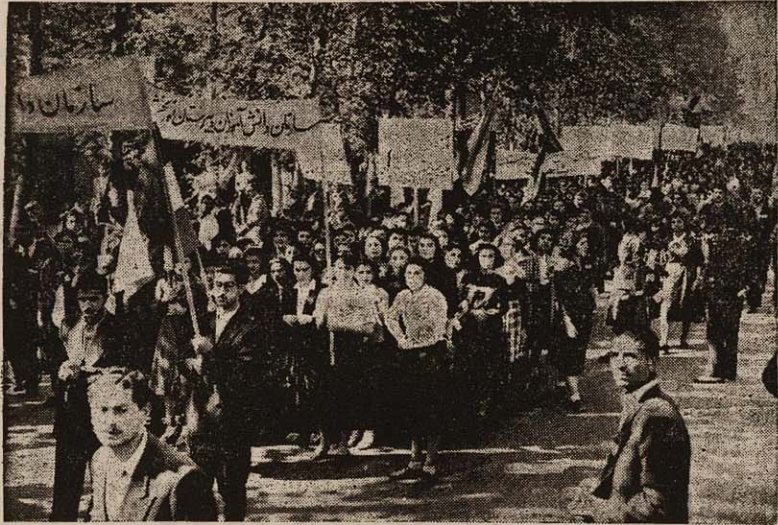
دانشجویان دختر و پسر از خیابان شامرها یاشار های خود بصورت میکنند