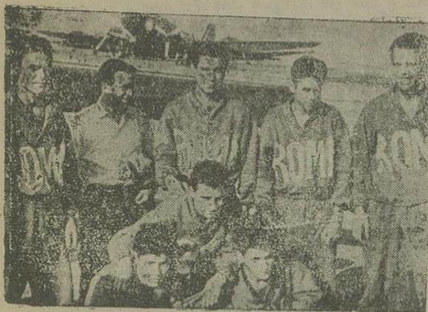
ورزشكاران ايتاليائى در فرودگاه مهرآباد