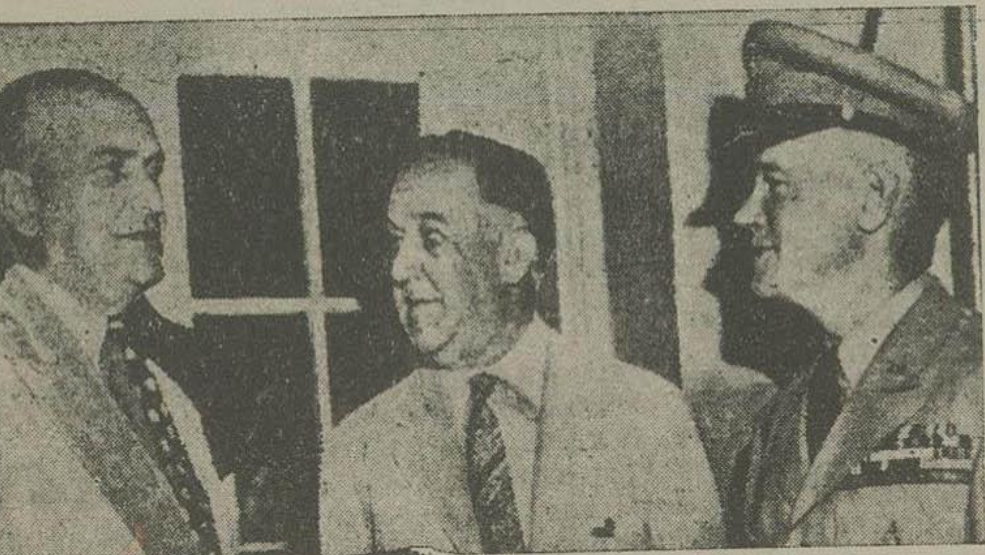
آقایان مصدق، مکی و رضوی در جلسه مجلس شورای ملی.

دول بریتانیا کبریا و اتحاد جماهیر شوروی و ایالات متحده امریکا با تشکیل کمیسیون سه گانه برای رسیدگی بمسائل ایران موافقت حاصل کرده و این موافقت را بدولت ایران جهت موافقت نظر آن دولت ابلاغ میدارند. مقررات موافقت مزبور بقرار