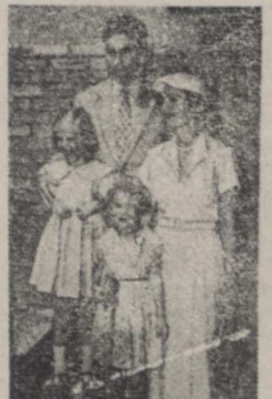
معاون رئیس جمهوری امریکا