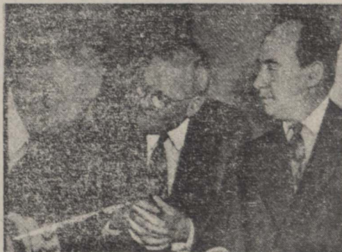
ایزنهاور و دلس مشغول مذاکره با استیون در باره پیمان عدم تجاوز با شوروی میباشند

سناور نولند رهبر حزب جمهوری خواه امریکایی در روز نعلی ایران درود اعلام نمود که با انعقاد هرگونه پیمان عدم تجاوز با اتحاد جماهیر شوروی مخالف است مگر آنکه شوروی اجازه دهد در کلیه کشورهای بلوک شرقی انتخابات آزاد بعمل آید. وی اضافه کرد که در این باره نظر شخصی خود را اعلام نمیدارد و دولت امریکا مشغول مطالعه پیشنهاد استیون میباشد.