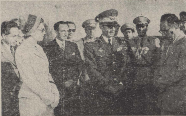
در عکس بالا اعلیحضرت مهابونی و علیاحضرت ملکه تیل از بازگشت تهران در فرودگاه و امسر دیده میشوند آقایان دکتر صالح وزیر بهداشتی، علم پرست املاک، اشرتی استانداز مازندران و سر تیب صبری فرمانده کارد سلطنتی نیز شریک است.

شاه و ملکه نامدنی در کاخ سعدآباد بسر خواهند برد ساعت پنج بعد از ظهر روز گذشته اعلیحضرت مهابونی با تاقان علیاحضرت ملکه تریا با هواییای سلطنتی از راجس تهران مراجعت کردند. در فرودگاه تیسار سیهبذاهدی نخست وزیر و آقای ملا وزیر دربار شاهنشاهی و روسای دربار شاهنشاهی قیلا حضور یافته بودند. مقارن ساعت پنج بعد از ظهر هواییهای سلطنتی وارد فرودگاه گردید و اعلیحضرتین آن بیاده شده