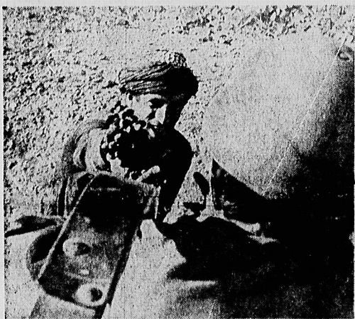
سربازان ارتش جمهوری در سر راه خود به سردشت بارها با اسفندال برادران کرد روبرو شدند، در اینجا یک جوان کرده به سربازی که عازم سردشت است انگور تعارف می‌کند.