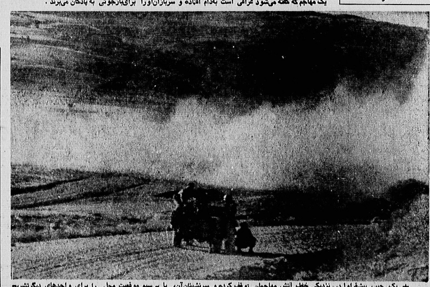
یک جیب پیشرو را در نزدیکی خط آتش مهاجمان توفیق کرده و سرنشینان آن، با بی‌سیم موقعیت محل را برای واحدهای دیگر تشریح می‌کنند. این محل، منطقه‌ای در نزدیکی سردشت است.

آگهی گزینش دانشجویان برای دانشکده معماری و شهرسازی دانشگاه ملی در صفحه ۹