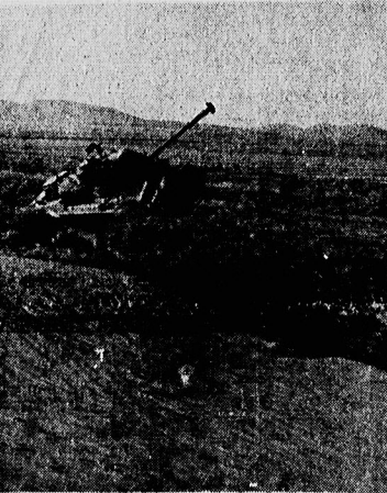
این یکی از ناگهان است که مهاجمان در اختیار داشتند و در جریان عملیات بوسیله نیروهای ارتش جمهوری از کار انداخته شد.