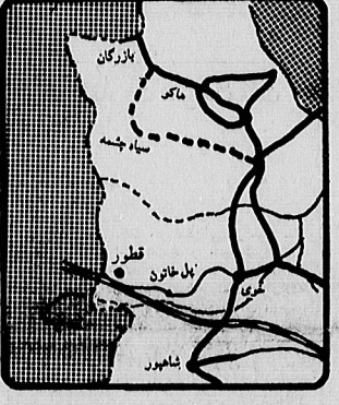
مسیر خط آهن در آذربایجان غربی و ایستگاه - طوریک ۶۰ کارمند راه آهن در آن به گروگان گرفته شدند، در نقشه مشخص است

گروگانها از لحاظ مواد غذایی در مضیقه هستند در صفحات ۱ و ۲