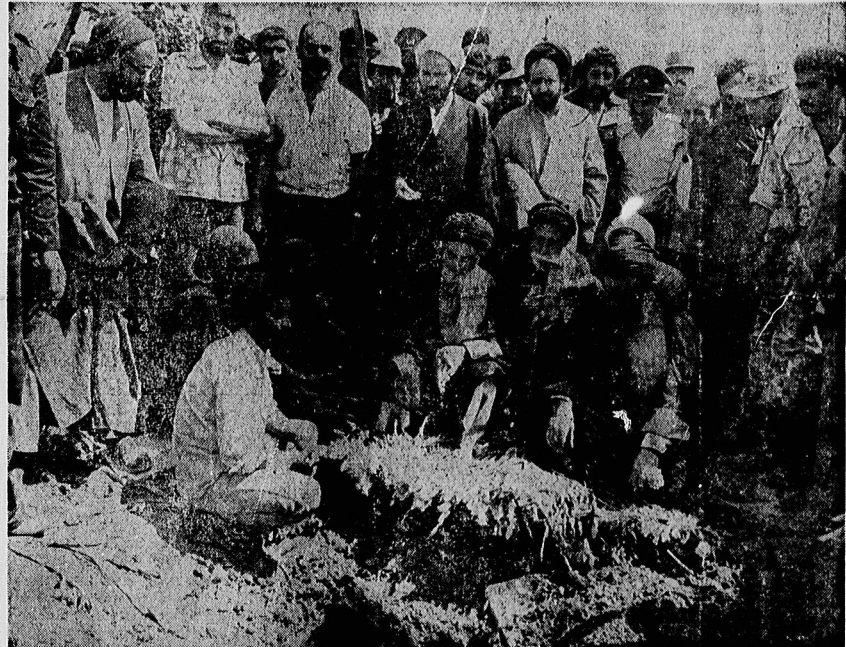
لحظات آخرین وداع با «پدر طالقانی» که ده دل کندن و سپردنش به خاک چه دردناک و غیر قابل تحمل است.

خبر درگذشت طالقانی ، مهمترین خبر ۲۴ ساعت گذشته تمام خبرگزاری - های جهان بود