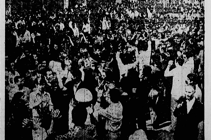
طاققانی، طاققانی، راحت ادامه داده سرگناه دپروز با این فریاد انسانی ساری مردم ازاده ای که از نخستین ساعات درگذشت مجاهد نستوه در اطراف منزلش جمع شده بودند، تهران از غراب پیدار شد. فریادی که شامگاهان از سراسر ایران بگوش می رسید.