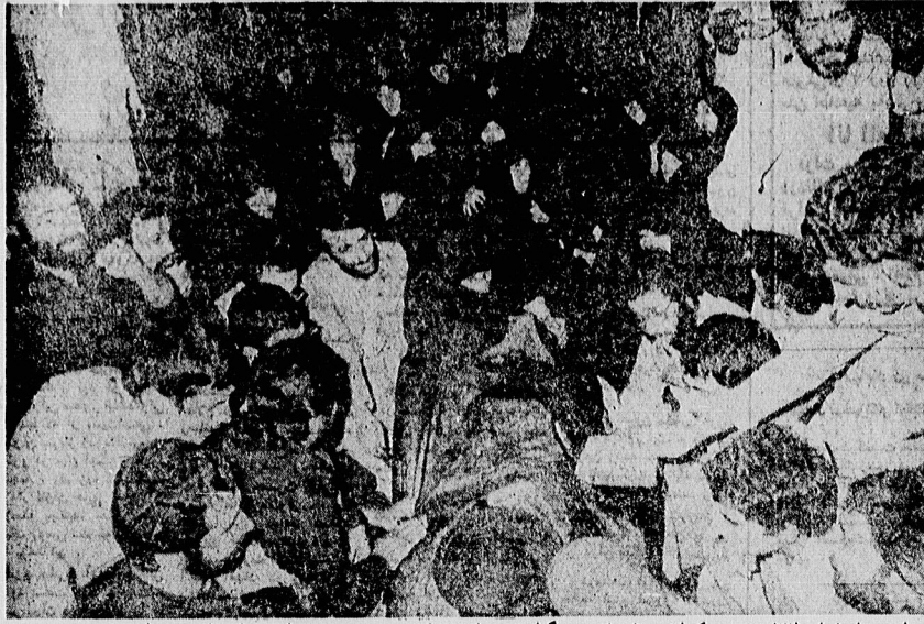
این تنها دختران طاققانی نیستند که آخرین بار، با پدر بزرگوار خود وداع می کنند، او پدر همه دختران و زنان مبارز و مجاهد و پیشوای همه ی مردم انقلابی بود.