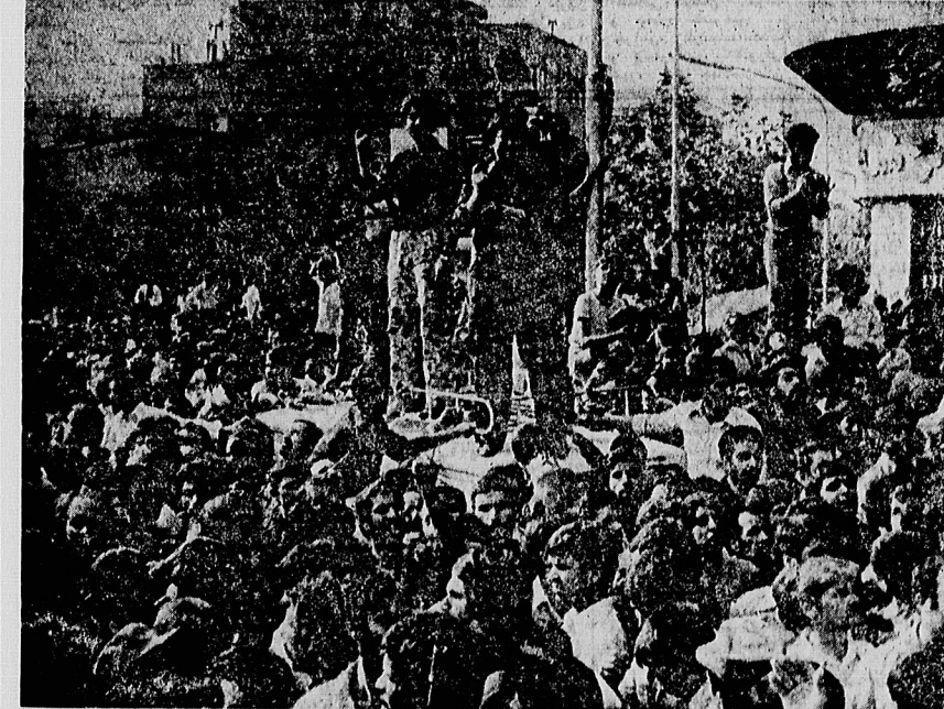
جانبازان انقلاب، فرزندان راستین این مجاهد نستوه، با چشمانی اشکبار و سلاح برکف پندر طاقانی را تا منزل ادبش بدرقه می کنند