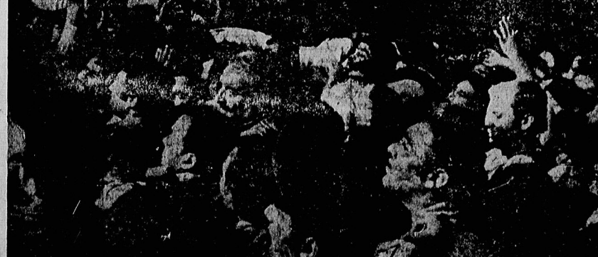
الله اکبر... الله اکبر... لاله الاالله... این فریاد انسانی طاقتور شکن که پایه های رژیم جبار را به لرزه در آورده بودند، دپروز بدرقه راه مجاهدی بزرگ و مبارزی نستوه بود که فریادش علیه پیداه رژیم انبکسانی صعبه جوانان رزمنده در شگجه گلهها و میدانهای تیر بود.