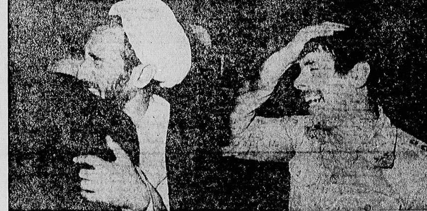
مردم تهران، نه مردم سراسر ایران، از سحرگاهان که خبر درگذشت پدر طاققانی را شنیدند بر سر زدند و بر سینه کوفتند. مرد وزن پیرو جوان، نظامی و روحانی در هجرت بی بازگشت رهبر به سوگ نشسته اند.