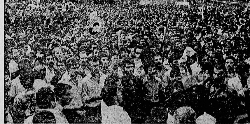
جمعیت، آرام، مبهوت و خرددار، به سخنان یکی از هم‌زمان قدیمی آیت الله طاققانی گوش می دهند. در چهره های مغموم جوانان به وضوح می توان چنین خواند: هراه انقلاب، راه مبارزه با استبداد، راه طاققانی تا پایان ادامه دارد.