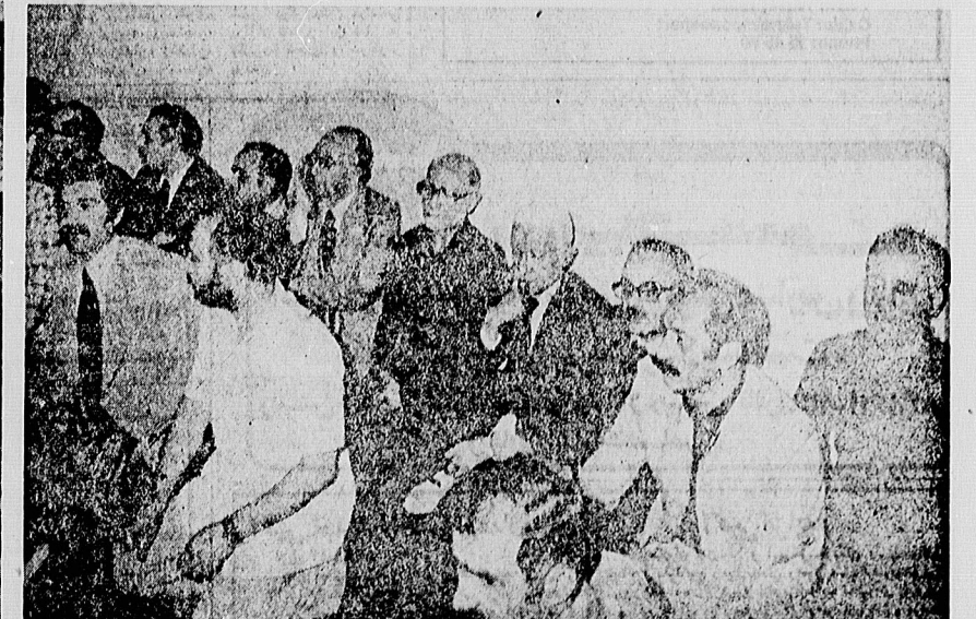
هنوز دقائق چندانی از بیوستن مجاهد نستوه به ملکوت اعلی نگذشته بود که باران دیرین و همزمان بیکر او در کنار پیگیری جانش گرامدمند مهندس بازرگان، هم‌راه، هم‌زم و هم‌بند سالیان دراز مبارزه و حسیس و تبعید او، و نیز مینمایی وزیر ارشاد ملی و فروغوزبرگار کثیرانی وزیر مسکن و شهرسازی از ارجله بودند.