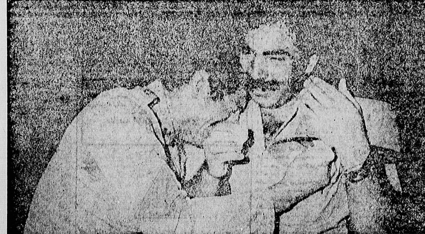
در خیابانها، در کوچه ها، در منزل و اداره هرجا که خبر درگذشت انقلابی فساد ناپذیر و مجاهد خشکی ناپذیر دهان به دهان می گفت، سیل اشک از دیدگان جاری می شد که گوشی ملت، عزیزی از نزدیکترین عزیزانش را از دست داده است.