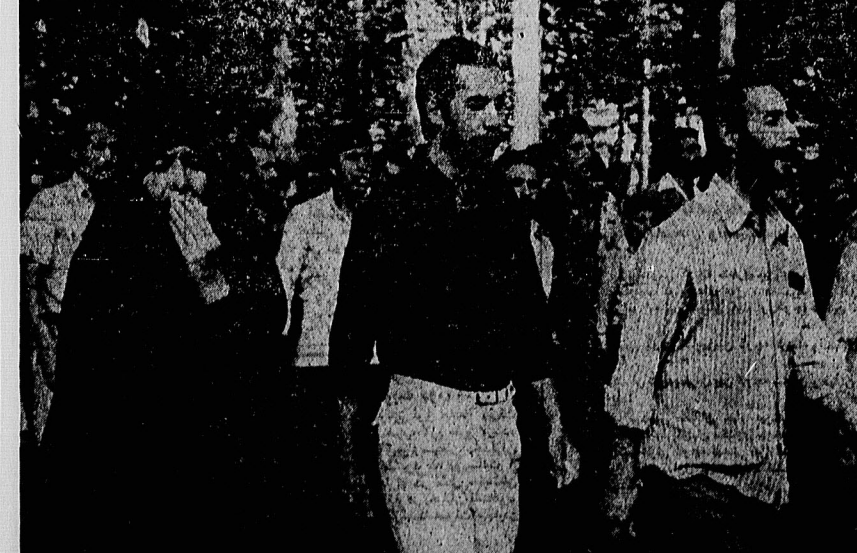
از لطفه ای که سیر بهت انگیز رحلت علامه گبیر و مجاهد راستین حضرت آیت الله سیدمحمدحسین طاققانی در تهران دهان به دهان گفت، سیل جمعیت به سوی منزلش به راه افتاد. انبوه جمعیت، اشک برچشمان و فریاد بر لب تا شامگاه خروشان بود.