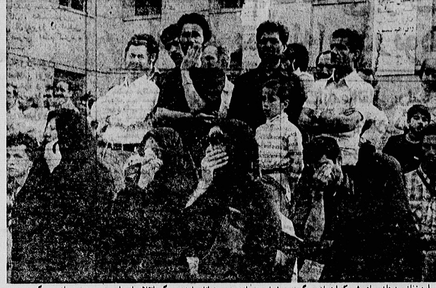
این زنان و مردان سیاهپوش، که اینسان می گریند، در غم از دست دادن رهبری توانا، مبارزی بزرگ، انقلابی ای راستین و پدری مهربان به سوگ نشسته اند. در حرکت و کنار تهران، چنین صحنه هایی فراوان بیستم می خورد.