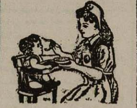
اولین مطب حفظ کودکان سالم

تغییر نام خانوادگی نام خانوادگی این جناب رضا بلفروشان شناسنامه شماره ۱۰۱۵۷ امقهار با آراسته تبدیل یافته است ۱۳۳۳-آ ۱۳۴۰-آ در سه ساعت سوزاک حاد سفاسی شاکردر بیک هفته خیابان شاهپور جنب مینا خیابان دکتر جلال بهی زاد ۱۳۴۰-آ ۵-۴