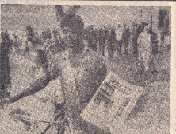
پاکستان روابط دیپلماتیک خود را با هند قطع کرد

پاکستان روابط دیپلماتیک خود را با هند قطع کرد. ارتش پاکستان یک شهر کشمیر را تصرف کرد. هند پاکستان را به تصرف خود درآورد. هند پاکستان را به تصرف خود درآورد. هند پاکستان را به تصرف خود درآورد.