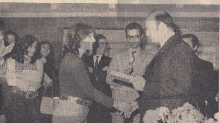
رئیس دانشگاه تهران پس از صرف ناهار جوایزی به بازیگران نامشاهه روسی بزنگاور هدیه میکند.

بچه ها امروز گشت و گانه کرده‌اند و ایام باوقیرو پنج تا دارند نامه گشت و رفته . دیگر از ایام نظرها و گردن بند خوری نیست . یکی از بچه ها می گوید : شگاه کن هدایت خطی خودشو ساخته و بنگر دیگر می گوید : « بابا از آن پاهای دست نمیده ، مگه چند بار منگنه رفتی دانشگاه ، ماهارو به ناهار دعوت کنه . کارتا خبری ، کارگاه آموزشی زبانهای گوناگون ، روزنامه نویسی و موبایله چه هنار زبانهای نامشاهه روسی بزنگاور ضیافت میدهند . عندای از بچه های رشته موسیقی نیز میمانند و همه آماده در حال حرکت . بول بچه ها مورش ، برف ناهار خوری ، در حدود پانزده دختر و پسر در راه بین دانشگاه هنر های زیبا و سال ناهار خوری سعی می کنند خندند و قیانه بگیرند .