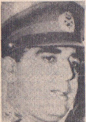
ژنرال یحیی خان به ارتش پاکستان فرمان داد تا تمام قوا برای عقب راندن قوای مهاجم هندی جنگند.