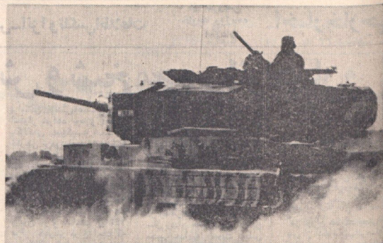
هند و پاکستان دو سخت‌ترین نبرد نانگها درگیر شده‌اند. این عکس از یک تانک هندی در منطقه راجستان پاکستان هنگام عملیات جنگی گرفته شده است.