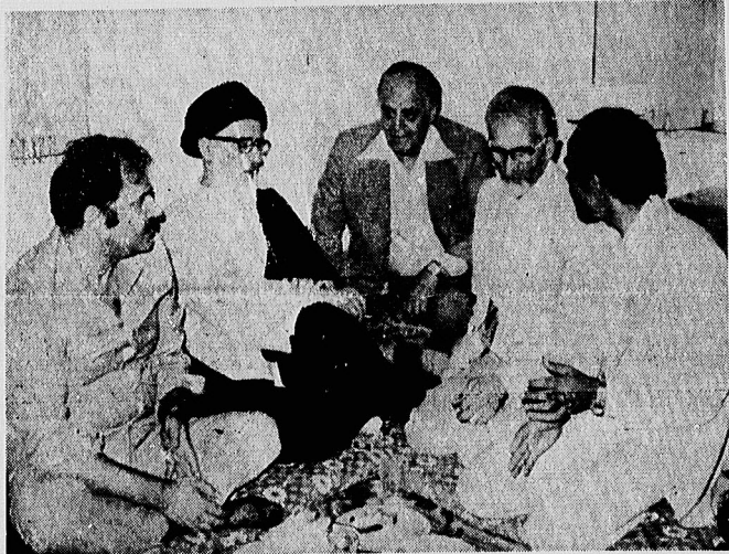
شیافتی به افطار، از سوی هانی‌الحسن نماینده سازمان آزادی‌بخش فلسطین و با حضور آیت‌الله‌القلانی در محل سفارت فلسطین در تبریز یافت

در محل سفارت فلسطین نماینده سازمان آزادی‌بخش فلسطین و با حضور آیت‌الله‌القلانی در تبریز یافت