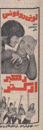
لوتوس و فوفوس دقیق سینما

کمترین برنامه نوروز از صبح چهارشنبه ۲۶ اسفند ماه در سینما