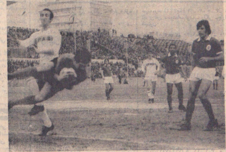
دو دیدار دیروز پاس - بنفیکا، دروازه بان تیم پر تقالی بیش از دیگران زچر کشید. چه دروان لحظاتی که پاس پایبای حرف بازی ادامه میداد و چه در لحظاتی که بنفیکا با گلپاسی خود از حریف پیشتی گرفت. در این عکس دروازه بان بنفیکا با سرعت عمل تویی را از جلوی مالکیان میراند.

یکشنبه ۲۳ اسفندماه دیدار دومین مسابقه تیم فوتبال بنفیکا با پاس در تهران انجام شد. در این دیدار پاس با گلپاسی خود از حریف پیشتی گرفت. در این عکس دروازه بان بنفیکا با سرعت عمل تویی را از جلوی مالکیان میراند.