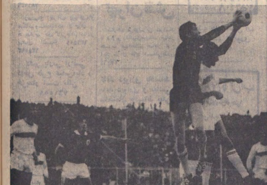
در این دیدار پاس با گلپاسی خود از حریف پیشتی گرفت. در این عکس دروازه بان بنفیکا با سرعت عمل تویی را از جلوی مالکیان میراند.

تیم فوتبال بنفیکا در دیدار دومین مسابقه تیم فوتبال بنفیکا با پاس در تهران انجام شد. در این دیدار پاس با گلپاسی خود از حریف پیشتی گرفت. در این عکس دروازه بان بنفیکا با سرعت عمل تویی را از جلوی مالکیان میراند.