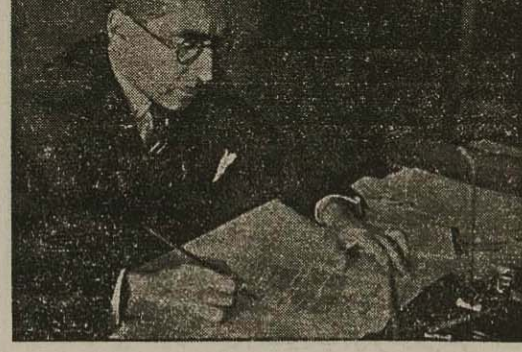
آقای سر لشکر فیروز وزیر راه

زیرا بجز بده دیده ام حرفها و تذکراتی که توأم با پیشنهاد و طرح و بالاخره عمل نباشد سر سوزنی برای کشور و جامعه سودمند واقع نشده در حکم باد هواست.