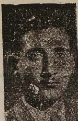
تغییب وجود خود را مسترد ننماید