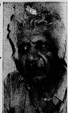
منصور باقریان یکی از عوامل کودتای ۲۸ مرداد و تهیه کننده فیلمهای فارسی

● زنان اعدام شده از سر - دمداران باندهای فحشاء بودند ● يك تهیه کننده فیلمهای فارسی نیز جلوی جوجه اعدام ایستاد