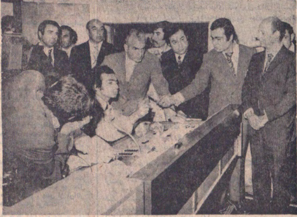
شاهنشاه آریامهر در مراسم گشایش تلویزیون آذربایجان مرکز تبریز در اطاق فرمان زکارتگان این قسمت درمورد کار دستگاه ها سئوالاتی میفرماید.

در اصفهان، اراک، قزوین تبریز بایدلوله گاز کشید تلویزیون تبریز بدست شاهنشاه گشوده شد شاهنشاه در بازدید از دانشگاه تبریز ضمن ابراز رضایت اظهار امیدواری فرموده که در بازدید آینده نقائص تکلی برطرف گردد در صفحات ۴ و ۱۷