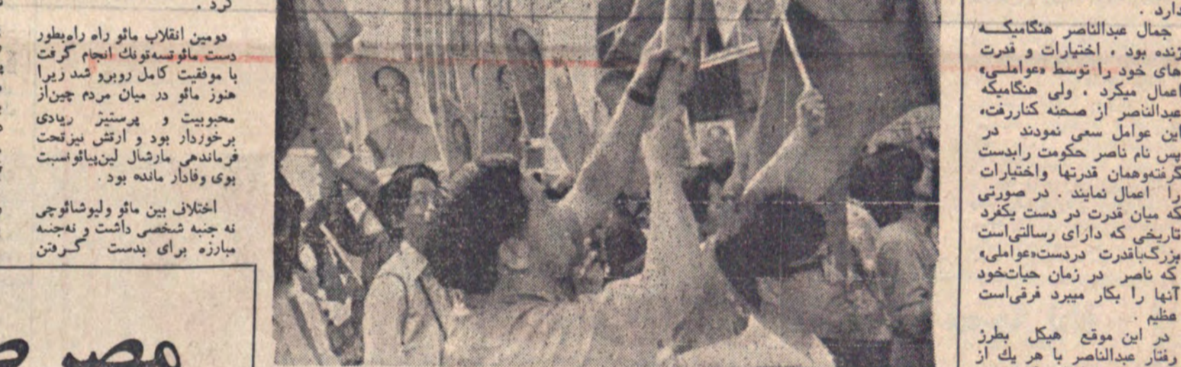
گروهی از اعضای کمیته مرکزی حزب کمونیست چین در جلسه‌ای در پکن. در این جلسه هیکل با مدیران حزب کمونیست چین دیدار کرد.

پایتختی به آزمایش‌های انفجاری پایان داده و برای مردم تاحدی راه و آزادی قائل شد. هیکل گفت: «چین بعد از دومین انقلاب ۵۰۰ هزار گارد سرخ چوئن لای را زدنانی کردند».