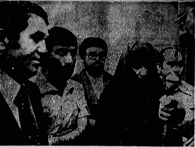
دستور حجت الاسلام رفسنجانی پس از اطمینان از اینکه خطر گذشته است بیمارستان شهدا را ترک میکند در کنار او تنی چند از نزدیکان و آشناان دیده میشوند.