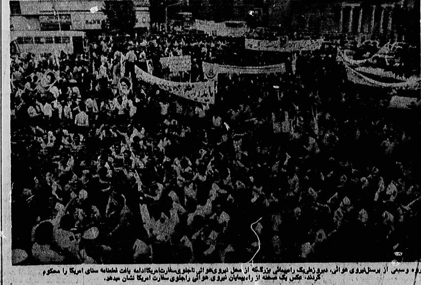
گروه وسیعی از پرسنل نیروی هوایی، نیروی زمینی و نیروی هوایی تاجوی سوار بر تانکها در راهپایه های آمریکا را محکوم کردند. بخش یک صحنه از راهپایان نیروی هوایی راجلوی ستارت آمریکا نشان میدهد.

رئیس کل ستاد ارتش ملی اسلامی: یکان های ارتش در سراسر کشور بخش میشوند از دهربران احزاب برای نوسازی ارتش دعوت خواهد شد در صفحه ۲