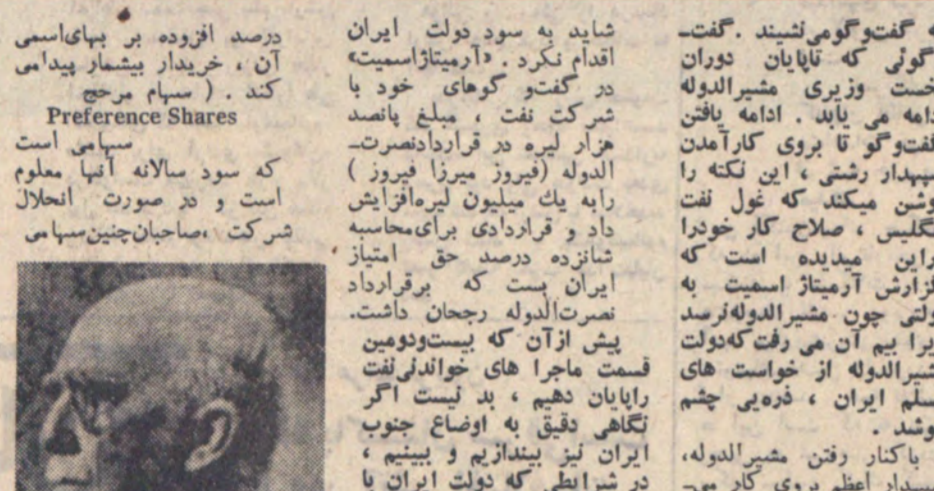
رژ چارلز گرنوی ...