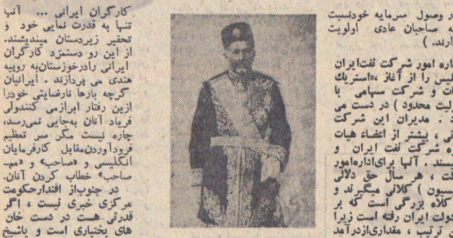
سپهبد اعظم گرش ...