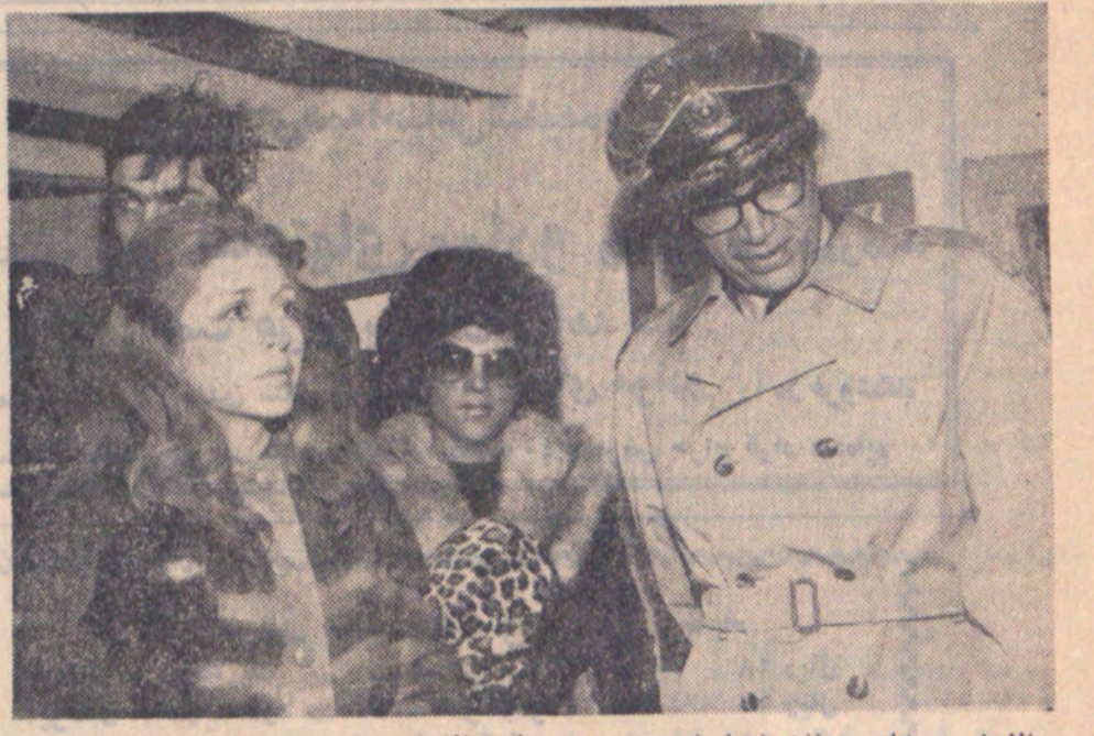
زادگی الاحضرت رضا شاه کبیر در بندر مینامند ... و الاحضرت پهلوی در زادروز رضاشاه کبیر گفتند: