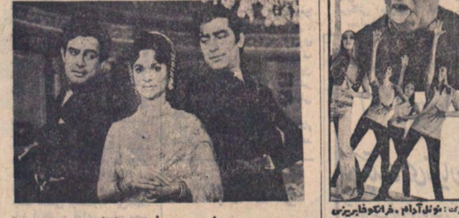
شرح در صفحه حوادث

از صبح پنجشنبه ۲۷ اسفند عالیترین برنامه نوروزی همای سعادت