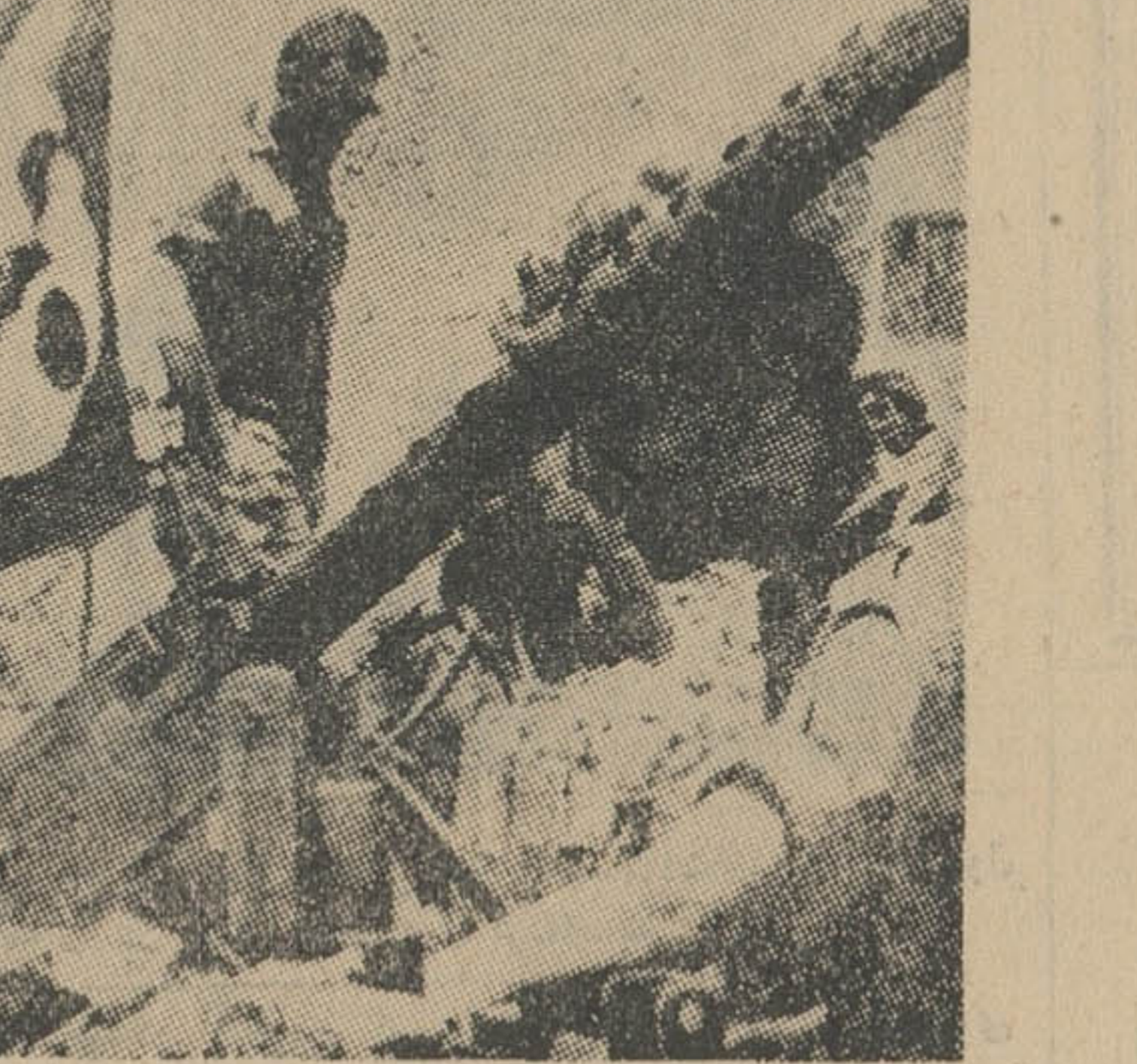
اسرائیلی‌ها با تجهیزات کامل صحرای سینا را از دو جهت دور زدند و خود را به کانال سوئز و بندر شرم‌الشیخ رساندند.

در ساعت ۸ بعد از ظهر روز پنجشنبه دوازده خلبان اسرائیلی که در حمله هوایی اسرائیل بموز غربی عراق دستگیر شده‌اند در