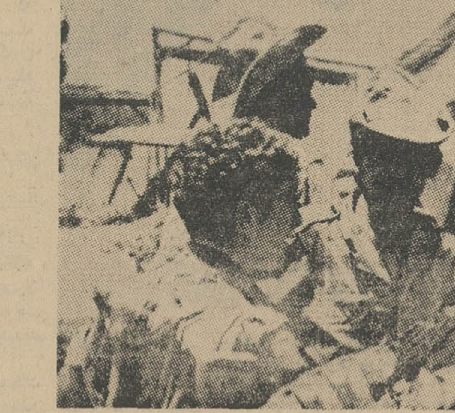
اسرائیلی‌ها با تجهیزات کامل صحرای سینا را از دو جهت دور زدند و خود را به کانال سوئز و بندر شرم‌الشیخ رساندند.

رادیو بغداد خبر داد که بر فرمان عبدالرحمن عارف رئیس‌جمهور