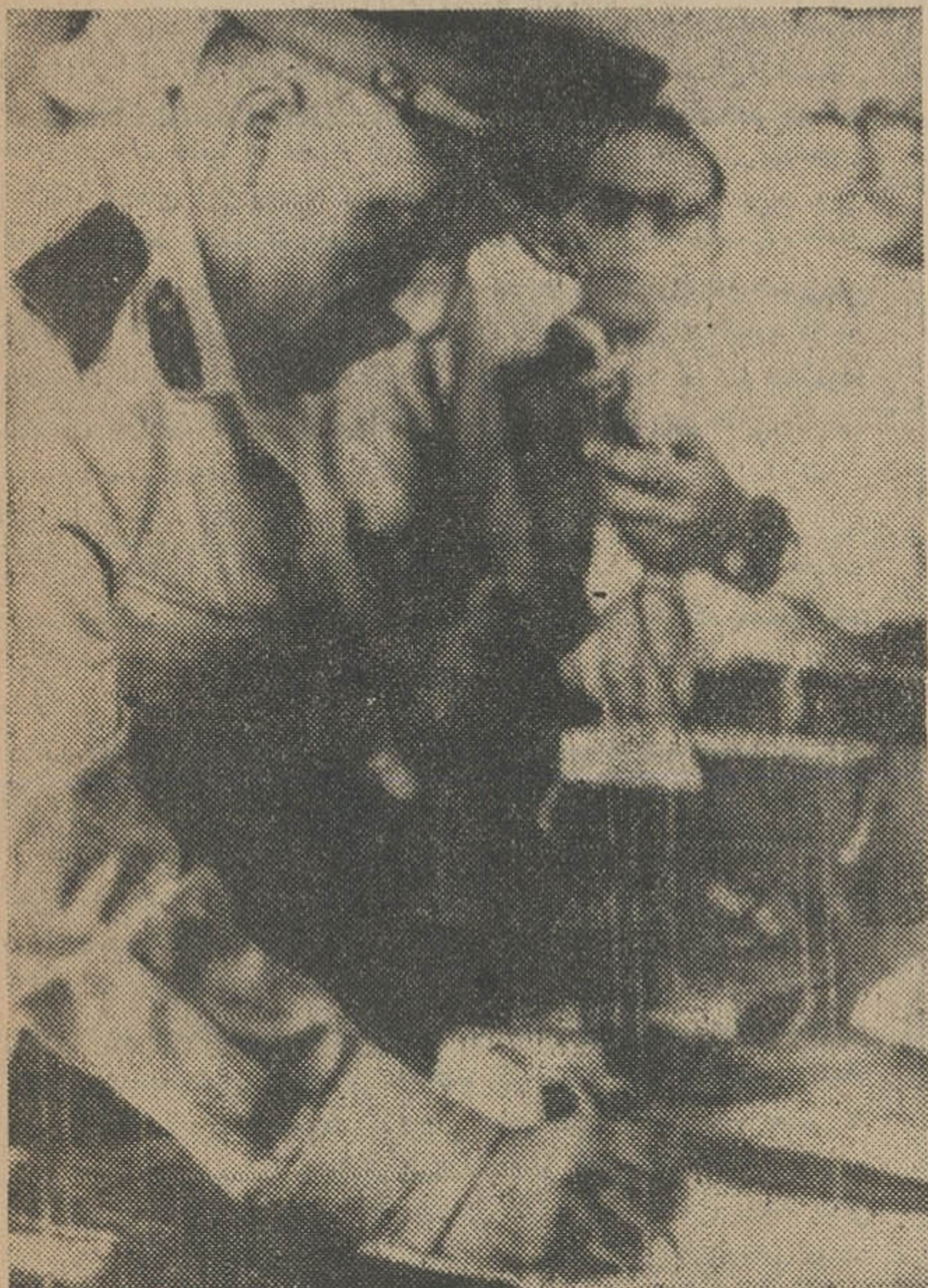
ژنرال عبدالمنعم حسنی، فرمانده کل نیروهای مصر در نوار مرزی غزه، که بدست نیروهای اسرائیل اشغال شد، موافقتنامه ترک مقاومت و تسلیم نیروهای خود را به ارتش اسرائیل امضاء می کند. بدنبال امضای این موافقتنامه، نوار مرزی غزه تحت کنترل کامل ارتش اسرائیل در آمد.

چند ساعت پس از اعلام آتش بس، نبرد اعراب و اسرائیل بار دیگر آغاز شد