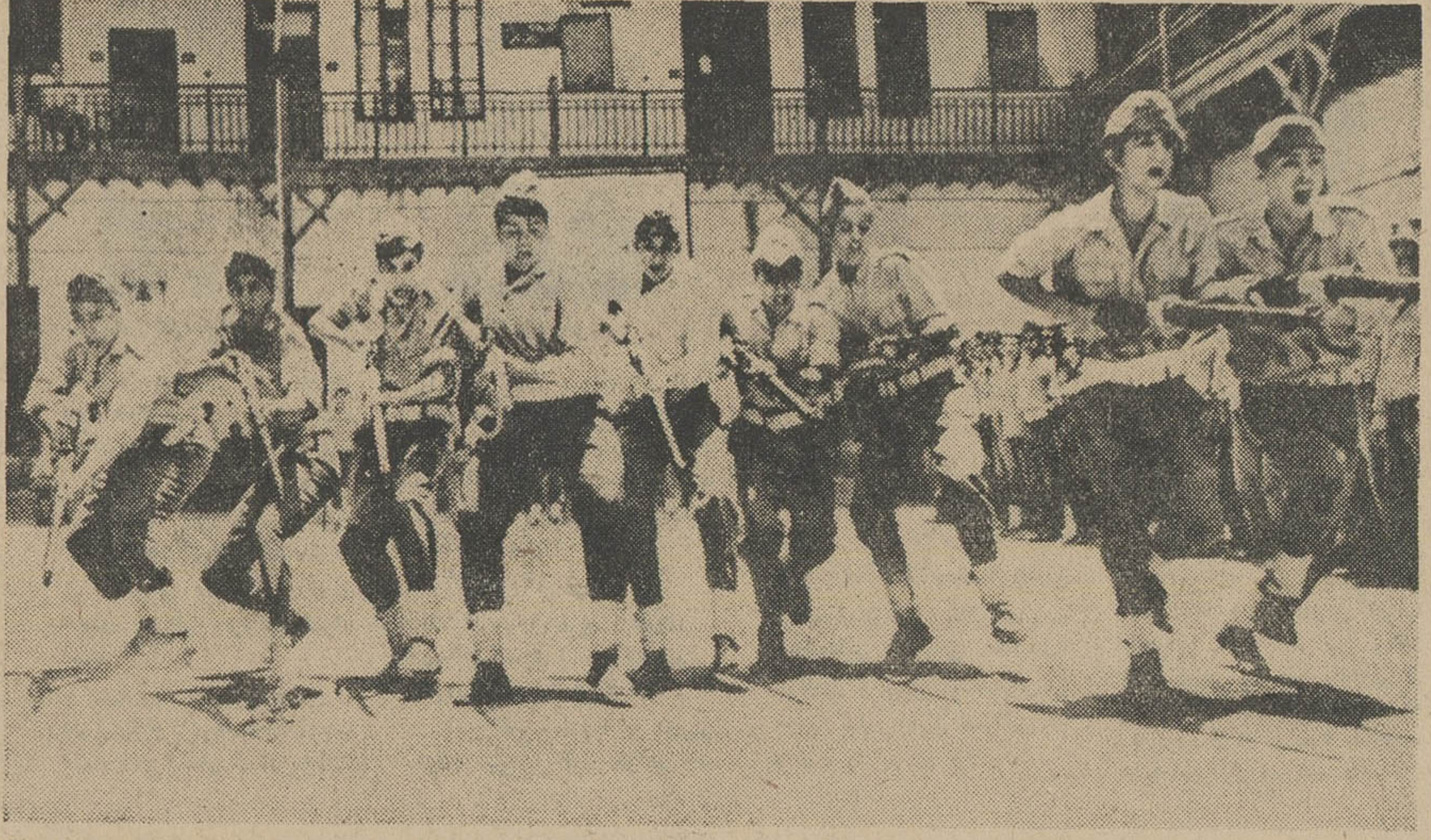
سربازان جوان مصری با شور و شوق به تمرین عملیات نظامی اشتغال دارند غافل از آنکه اشتباه محاسبه رهبر آنها، نتیجه فعالیت هایشان را نقشی برآب خواهد کرد . این عکس دو روز قبل در یک سربازخانه مصری گرفته شده است.

بنا بدعوت دفتر فنی لرستان مراسمی با حضور آقای دکتر سجادی فرماندار کل ، و شرکت روسای سازمان های دولتی ، محترمین محلی ، ورزشکاران جهت زدن اولین کلنگ ساختمان استادیوم ورزشی در محل زمین واگذاشته وزارت کشاورزی انجام یافت ، ابتدا نماینده ورزشکاران ضمن سیاستگرایی از مراسم شاهنشاه آریامهر ، مساعی آقای مهندس ذکائی رئیس کل آموزش و پرورش لرستان را در مورد تهیه مقدمات کار و واگذاری ۴۵ هزار مترمربع زمین از طرف وزارت کشاورزی و همچنین اقدامات آقای مهندس امیری رئیس دفتر فنی لرستان دانای به تکمیل اعتبار را ستود .