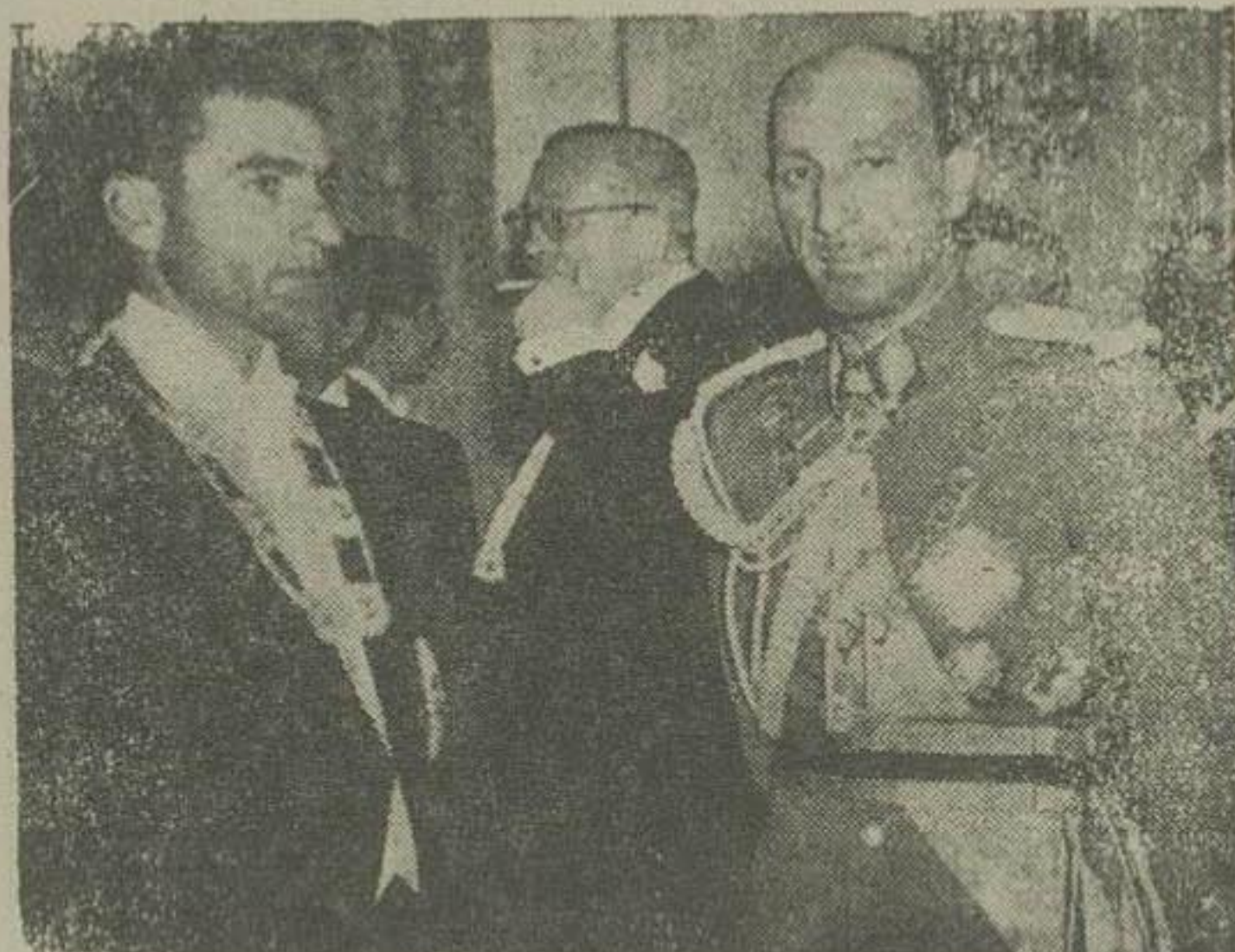
دیشب از طرف اعلیحضرت پادشاه افغانستان بافتخار اعلیحضرت همایون شاهنشاهی شینائی شام در محل اقامت ایشان کاخ والا حضرت شاهپور عبدالرضا داده شد.

در ضیافت مزبور والا حضرت شاهپورها و هیئت آقای نخست وزیر و نواب رؤسای مجلین شووری و سنا و همراهان اعلیحضرت محمد ظاهر شاه رؤسای نمایندگیهای سیاسی خارجی و جمعی از رجال شرف حضور داشتند. پس از صرف شام از ساعت ده بعد از ظهر نیز مجلس شب شینی آغاز شد و اعلیحضرت همایون شاهنشاهی با تفاق میزبان عالیقدر در مجلس شب شینی شرکت فرمودند. عکس بالای در شب شینی دیشب که تا ساعت ۱۲ ادامه داشت برداشته شده است.