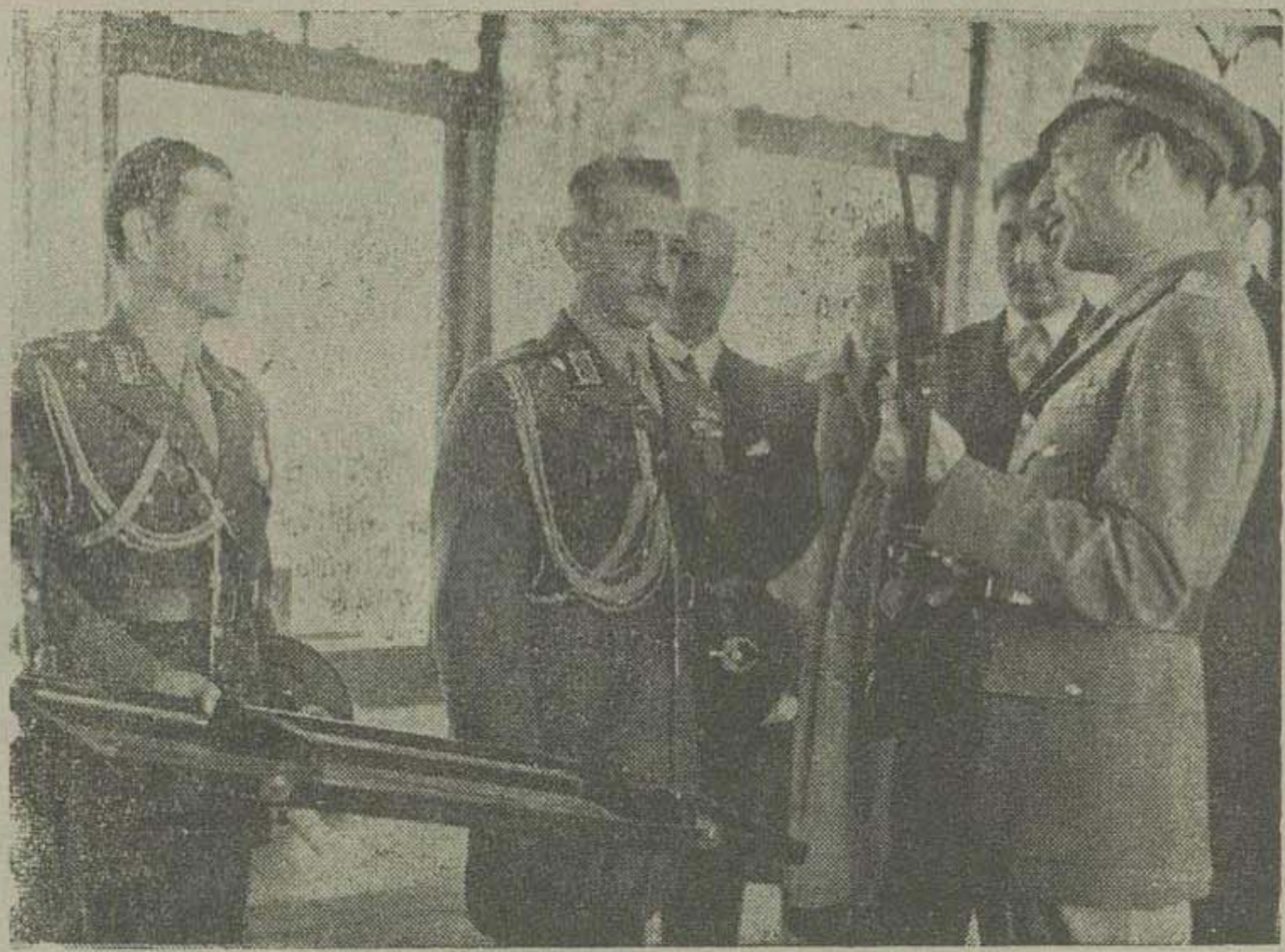
در بازدیدی که روز شنبه اعلیحضرت محمد ظاهر شاه پادشاه افغانستان از کارخانجات مهابت سازی ارتش در سلطنت آباد بعمل آوردند یک قبضه تفنگ از طرف ارتش در قاب مخصوص ، در تالار آینه سلطنت آباد بحضور معظمه تقدیم گردید . در این عکس آقایان سپهبد بزدان پناه و سپهبد رزم آرا در حضور اعلیحضرت پادشاه افغانستان هنگام اهداء تفنگ دیده میشوند.