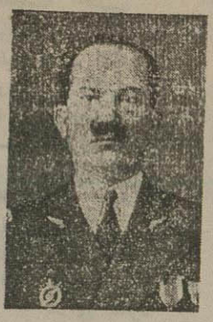
سرهنگ غلامحسین شیبانی

جنازه مراجعت نمودند. جنازه مرحوم سر تیپ ارفع در حضرت عبدالعظیم بخاک سپرده شد جنازه مرحوم سرهنگ قهرمانی در قم دفن میکردد و جنازه مرحوم سرهنگ شیبانی در امامزاده حسن و جنازه مرحوم سرگرد افغسی در آرامگاه مرحوم مظفر الدوله (شیران) بخاک سپرده شد.