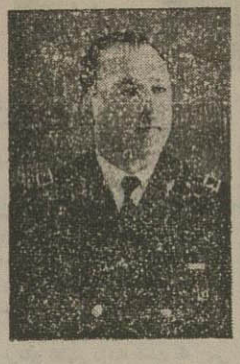
سرهنگ شرف الدین قهرمانی

جنازه مراجعت نمودند. جنازه مرحوم سر تیپ ارفع در حضرت عبدالعظیم بخاک سپرده شد جنازه مرحوم سرهنگ قهرمانی در قم دفن میکردد و جنازه مرحوم سرهنگ شیبانی در امامزاده حسن و جنازه مرحوم سرگرد افغسی در آرامگاه مرحوم مظفر الدوله (شیران) بخاک سپرده شد.