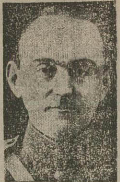
سر تیپ ابراهیم ارفع

جمعیت کثیری در دو سمت خیابان ایستاده بودند. سکوت مطلق خیابان را فرا گرفته و تاثر و اندوه فراوانی در مردم دیده میشد - جز صدای گریه در میان نرای ترا هیچ صدای بگوش نیرسید. جنازه ها باین ترتیب تا میدان سه و جلوی خیابان برق پیاده مشایع شد و در آنجا عده از تشییع کنندگان باز کشته و بقیه با اتوبوس جنازه وا مشایع کردند. صف های پیاده نظامیان و دانشکده افسری و موزیک نیز در کنار میدان معنی بجای احترام ایستاده و پس از حرکت