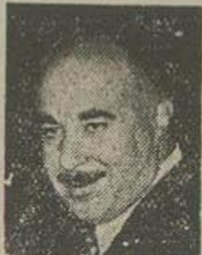
فرز خواهد گرفت.

کمیونیسم ایران و ترکیه را ترک گفته و در سایر نقاط خاور میانه فعالیت میکند