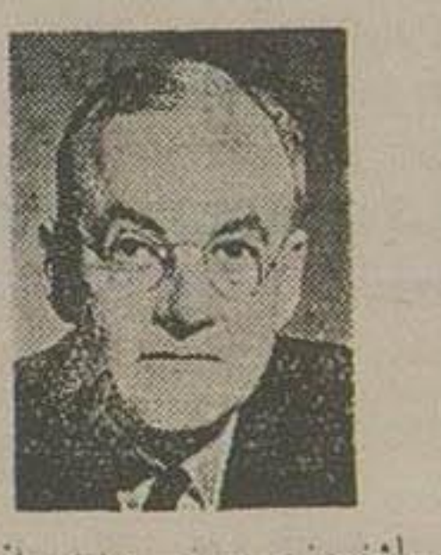
پروفسور و دانشمند سوسیالیست فرانسوی دموکرات کشته روز بطخارجه مجلس سنا در روز اعلام داشتند که عقیده ما کثیرا دالرو و نامه خا حاکم را بنا

میلیون ریاض اردن که عبدالناصر دولت سوز را مدیده نماد و زتمام مسائل علیه اسر ائیل استفاده نماید