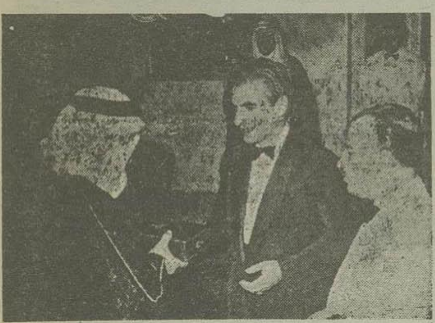
شاهنشاه بشاهزادگان سعودی نشان اهداء کردند