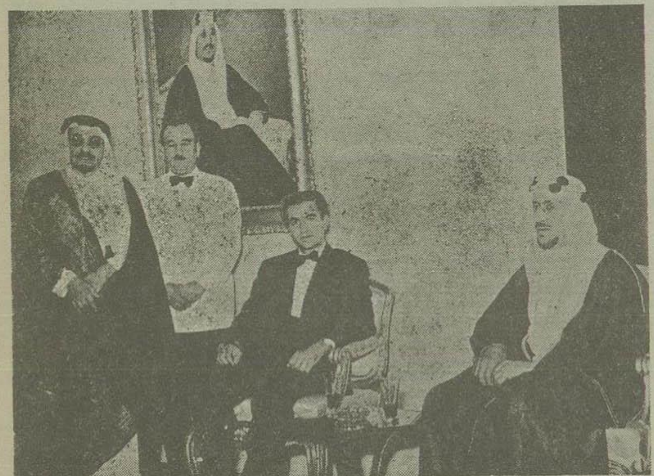
شاهنشاه و اعلیحضرت ملک سعود در ضیافت دیشب سفارت سعودی آقای حمزه غوث سفیر کبیر دولت سعودی و آقای آذری معاون اداره اول سیاسی وزارت خارجه که سمت مترجم دارد دیده میشوند

شکست گرمادر تهران امروز ۳ درجه گرما تقیل یافته است چنانچه در شماره دیروز اطلاع داده شد دستکامهای هواشناسی از سه روز قبل تشخیص داده بود که بطولت هوا زیاد شده این امر موجب گرمی هوای تهران خواهد شد و بطوری که مشاهده کردید در دو روز گذشته هوا بسیار گرم و خفه کننده شده بود ولی از دیروز در اثر بارانهایی که دو قطار شمالی بارید و باد و طوفانهایی که در اثر تغییرات جوی در آن ساعات روی داد مانع خنکی هوا به منطقه جوی تهران بقیه در صفحه چهارم