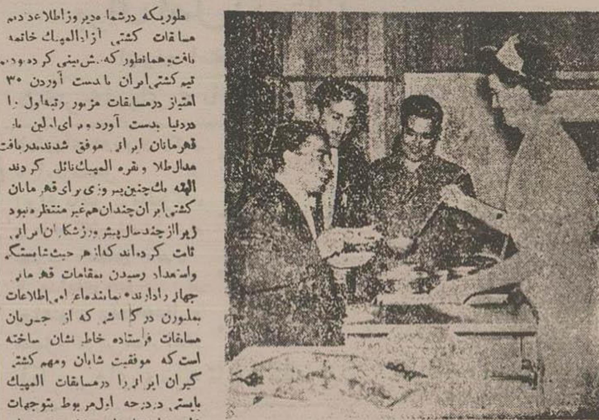
اقابان نامجو قهرمان سوم و سون جهان و جید بخیار رئیس فدراسیون وزنه برداری و سرهنگ خیر واپار رئیس باشگاه تاج هنرگم کر قن غدا در ستوران و بلای و ورزشکاران ایرانی در ملیون

طوری که در شما دیر و اطلاع دادیم هر کدام از شما که برای ایران کسب و کوشش و اداشته مسابقات کشتی از المپیک خاتمه یافت همانطور که پیش بینی کرده بودیم این فرمایش ملوکانه در تیم کشتی ایران نایب دست آوردن ۳۰ امتیاز در مسابقات مزبور رتبه اول را در دنیا بدست آورد و ای این با قهرمانان ایران موفق شدند بدیناقت مدال طلا و نقره المپیک نائل گردیدند. الهی ملک چنین بزرگی برای قهرمانان کشتی ایران چندین بار غیر منتظره نبود زیرا از چند سال پیش ورزشکاران ایرانی ثابت کرده اند که از هر حیث شایسته و استعداد رسیدن مقامات قهرمانی چهار رادارند. ما شایسته این اطلاعات ملیون در گزارش که از جریان مسابقات فرستاده خاطر نشان ساخته است که موفقیت شان و مهم کشتی گران ایرانی در مسابقات المپیک بایستی در درجه اول مربوط به توجهات خاص شاهنشاه نامرئوس و تشویق های مطلقه از ورزشکاران ایران است علاوه بر اینها شاهنشاه قهرمانانی که عازم مسابقات المپیک بودند فرمودند