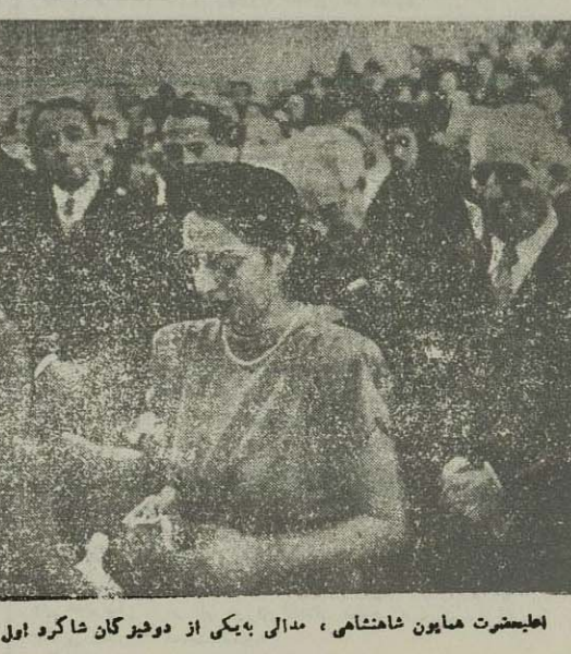
امپراطور شاهنشاهی، مدالی به یکی از دو فیرگان شاگرد اول دانشگاه اعطاء میفرماید

از جمله دانشمندان خارجی که در دوازده ماه اخیر دانشگاه تهران را دین کرده اند و در این جا نه توان از ذکر نام آن خودداری نمود آقایان پرنسور پاستور و آری رادو و پرنسور لاکسانی استادان دانشگاه پاریس بوده اند از تطبیق آقای پرنسور پاستور و آری رادو در دانشگاه ایران فردو همچنان در مضمون نامه‌هایی که این دو دانشمند از جمله در باره کشت پیاز به تهران ارسال داشته چنین بر میآید که دانشگاه تهران توجه آن‌ها را جلب نموده و برای کاری که در آن صورت میگیرد ارزش قابل همتند