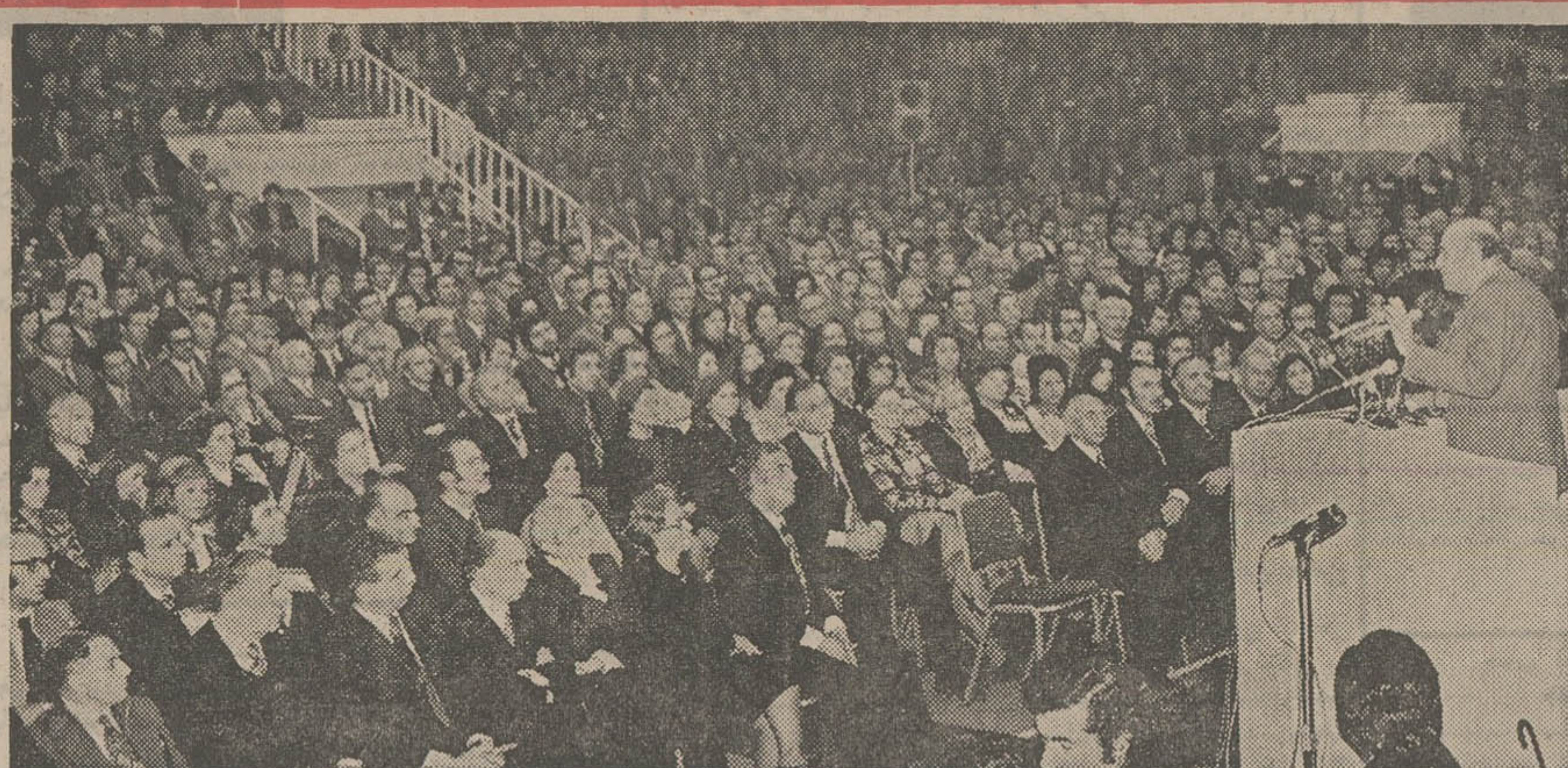
نخست وزیر در اولین اجتماع سازمان ارشاد ملی مردم راه همکاری بیشتر با دولت و گفتگو شنود اظهار نظر دعوت کرد.

سازمان ارشاد ملی که بیشتر از طبقه روشنفکران تشکیل شده در حقیقت یک مکتب خدمتگاری و یک مدرسه ایران سازی باید بشود. توقع دارم در هر جمع بشویم و جوانان را به هدف های ملی، به آرزوهائی ملی و به افتخارات ملی خود آشتان سازیم. و نه تنها فکر بدیهی بلکه در عمل دست بدست هم بدهیم و این اساس غلط را که مردم همکار ما را از دولت بخوانند یاد دولت همه توقعاتش از مردم باشد بدور بریزیم و بجایش این اصل را رعایت کنیم که در عصر انقلاب شاه و ملت باید همکاری بین دولت و ملت پیش از تمام ادوار تاریخ باشد.