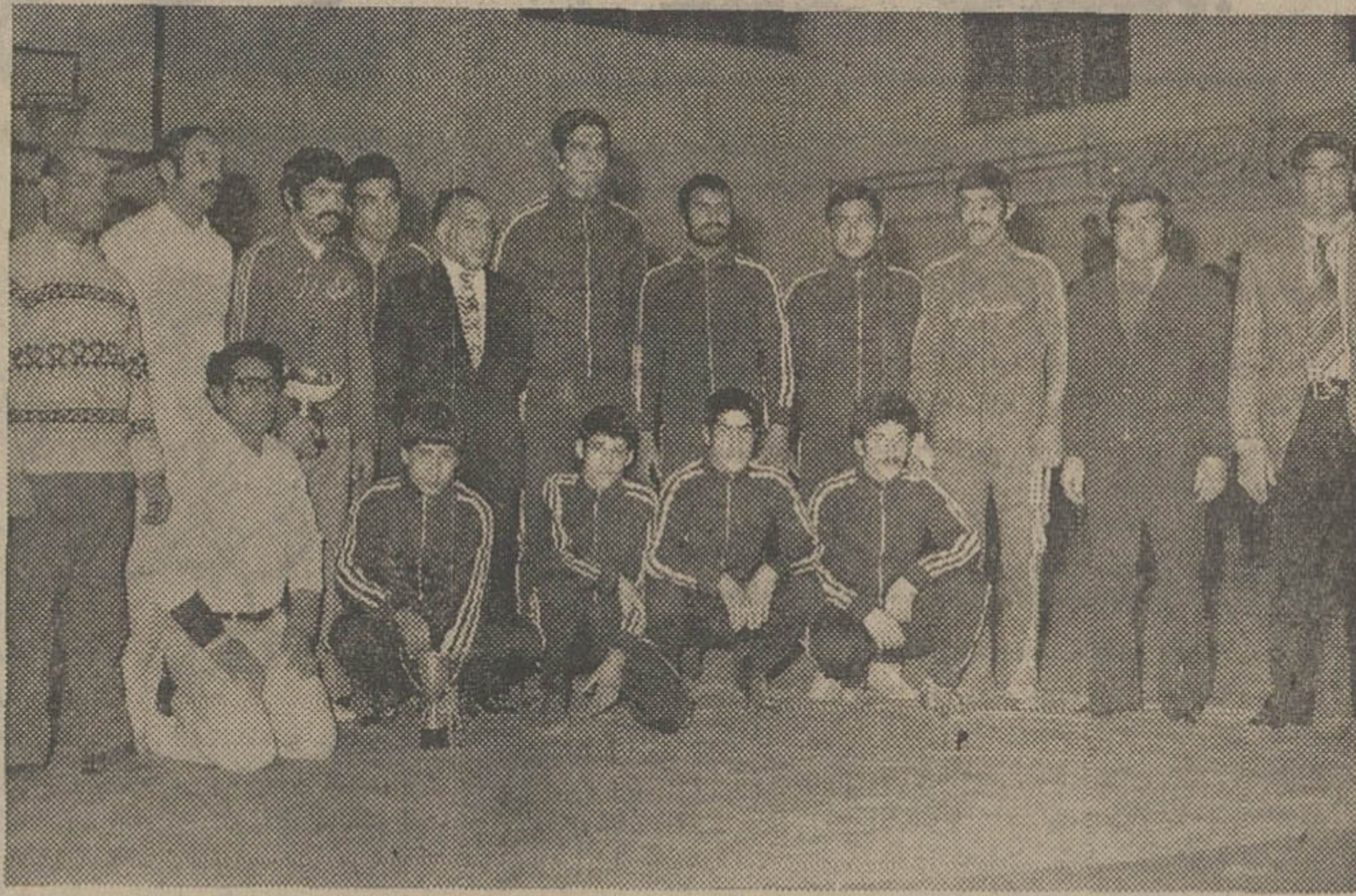
تیم کشتی شهرستان ری در مقابل رقبای شان به نام شیرانیا، سرانجام بمقام قهرمانی رسید. نفرات پیروز این تیم هره گروه داووان - مریان - سرپرستان در عکس دیده میشوند.

* شمیران - قم - قزوین - کرج - ساکنان مقامی دوم تا ششم را بدست آوردند.