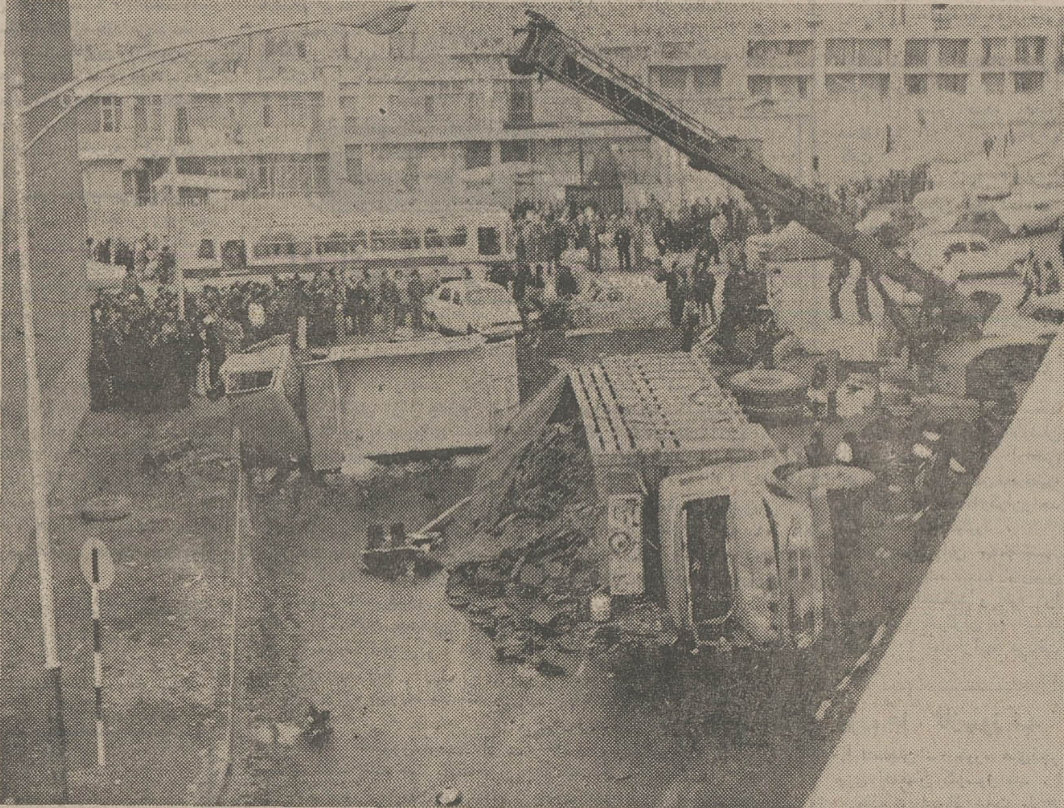
صحنه تصادف - در گذرگاه زیریل تاج اتومبیل‌ها با خیال آسوده منظر سبز شدن چراغ قرمز بودند که ناگهان کامیون غول بیکر به صف آنها زد و فاجعه‌ی خونین و بی‌سابقه بوجود آورد - عکس‌ها از مجید حسن پور، خبرنگار اطلاعات در غرب تهران

* کامیونی که بایک کامیون دیگر مسابقه گذاشته بود ناگهان به صف اتومبیل‌هایی که پشت چراغ قرمز ایستاده بودند زد ... و راننده آن از محل حادثه فرار کرد! * یک دختر دانشجو و یک جوان ۲۲ ساله کشته شدند و ۶ نفر بشدت آسیب دیدند * در محل حادثه، چشم یکی از مجروحین از حدقه درآمد و چشمش آسوتر پرتاب شد ... نیمه شب دیشب ۴ سارق به محل حادثه رفتند تا لوازم و وسایل اتومبیل‌های حادثه دیده را سرقت کنند!