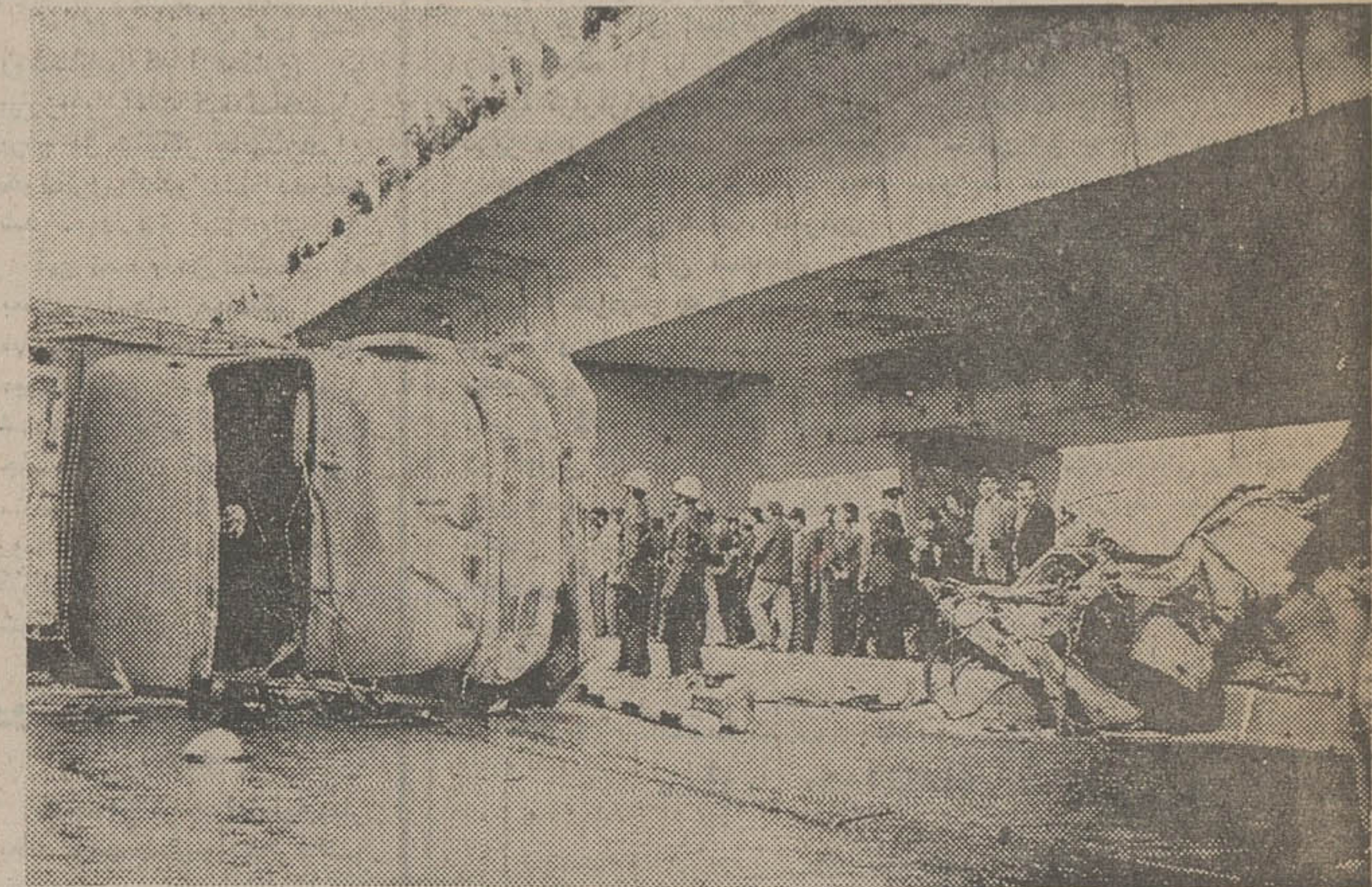
مرگ در زیر بل - این نخستین بار نیست که در زیر بل تاج، حادثه خونین رانندگی رخ میدهد. این گذرگاه تاکنون شاهد مرگ افراد بیگانه بسیار بوده و هربار، چون سرعت یک راننده فاجعه را بوجود آورده است. این بار هم جنون‌راننده کامیونی که به پهلو افتاده، مرگ آفرین این حادثه بود ...

در یک حادثه وحشتناک و بی‌سابقه رانندگی، که بعد از ظهر دیروز زیر بل تاج رخ داد، ناگهان یک کامیون غول‌پیکر، چهار اتومبیل و یک موتورسکات یک کبوترسویک موتورسوار را درو کرد و ۲ نفر را به کامپوک فرستاد و ۶ نفر را بشدت مجروح کرد و راننده آن‌خدایار معروفی متواری شد. شدت برخورد کامیون با اتومبیل‌ها به حدی بود که در یک چشم بهمیزدن، موتور یکی از اتومبیل‌ها از جا کنده شد و حدود یکصد متر آسوتیرتاب شد. سرشیشیان اتومبیل‌ها، بی در بی از درون وسیله نقلیه خود به بیرون پرتاب شدند و یک سر و دست ویای شکسته به گوشه‌ی افتادند و حتی چشم یکی از آنها، بلافاصله از حدقه درآمد و چند متر آنطرفتر افتاد! این حادثه تلخ و وحشتناک، ساعت ۳:۳۰ بعد از ظهر دیروز رخ داد و علت اصلی آن، بهرین ترمز کامیون و عدم توانایی راننده در مسابقه گذاشته بود! در لحظات این مسابقه دیوانه‌وار و خونین، دو کامیون دایما از یکدیگر سبقت میگرفتند و هرگاه یکی از کامیون‌ها عقب میماند، پا را با تمام قوا بر روی بدال گاز فشار میداد تا عقب ماندگی خود را جبران کند. خلیل بهرامی، خبرنگار ما که به محل حادثه رفته و با اهالی آن حدود و حوالی گفت و گو کرده است، از قول شهود حادثه مینویسد: در طول مسابقه دو کامیون، اتومبیل‌هایی که از آن جاده میگذشتند، از ترس دو غول