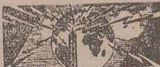
مشترک المنافع فرادار لندن تشکیل میشود نخست زیر دانمارک در گذشت این نهار

چین کمونیست حملات اتمی امریکارا با حملات اتمی پاسخ خواهد داد