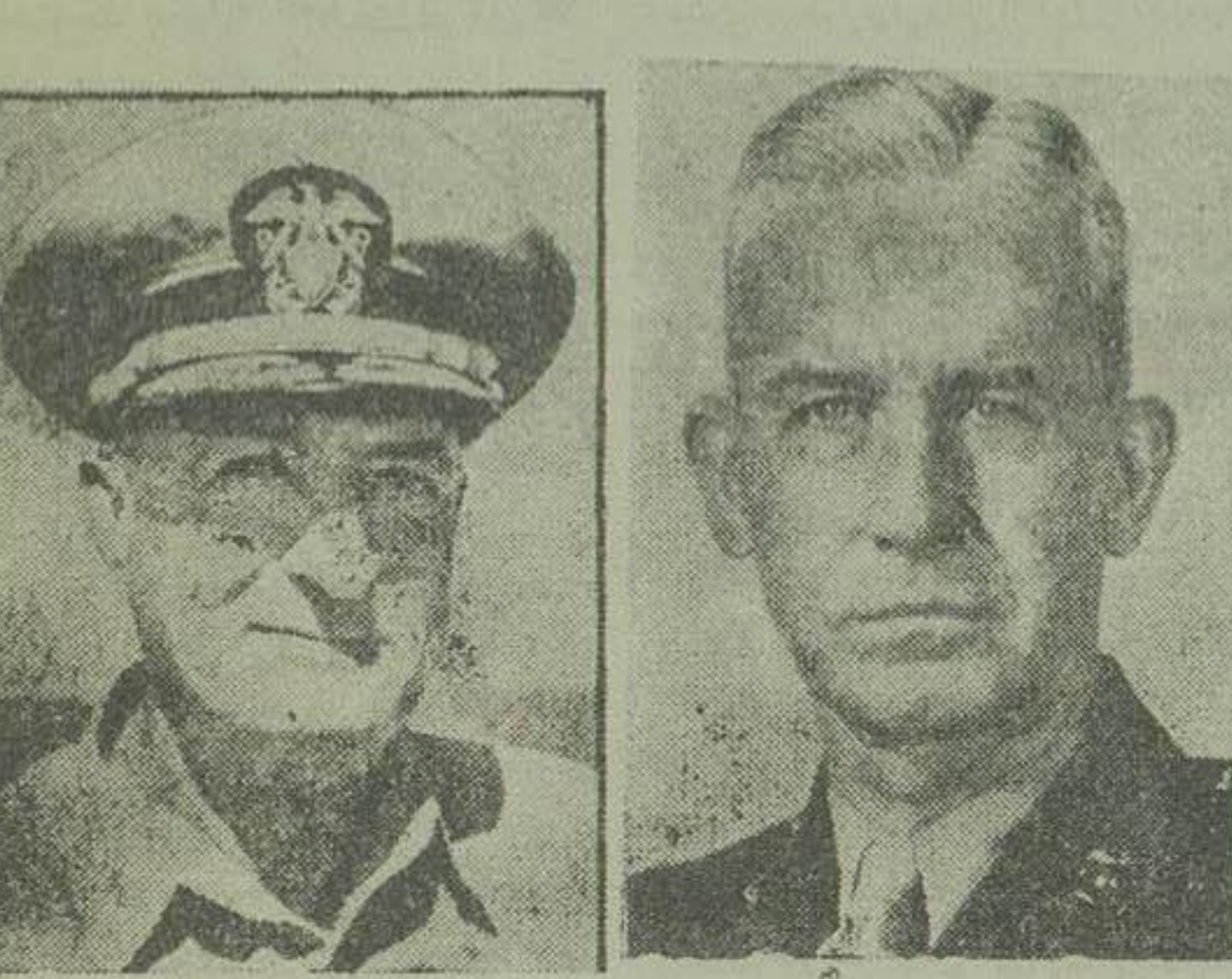
ژنرال اسمیت فرمانده لشکر اول تفنگداران امریکا ژنرال استر امیر فرمانده کل نیروهای عراقی ژنرال اسمیت فرمانده ناوگان عملیاتی دریانویان

کمونیست ها قبول نمیکند هنوز زود بود که یک جنگ خونین در کره شمالی سقوط شهر ستول را اعلام بکردارست. امروز صبح هنگامی که آتش از قسمت اعظم شهر «ستول» زبانه کشیده و ستونهای غلیظ دود تا یکپارچه تر و بفرز شهر متصاعد بود و هر لحظه چندین هزار تن سرباز کمونیست از دروازه شرقی بطرف مرز ۳۸ درجه عرض شمالی فرار می نمایند.