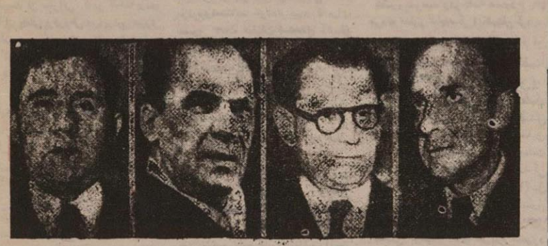
نمایندگان شوروی برای شرکت در گنفرانس سافرانسیسمکو عازم امریکاشدند

پاریس - اسوخته پسر - آژوره کرومیکو معاون وزارت خارجه شوروی با تفاق نمایندگان دیگر شوروی که قرار است در کنفرانس امضای پیمان صلح با ژاپن در سانفرانسیسکو شرکت نمایند بوسیله هواپیما وارد پاریس شدند. کرومیکو کلونیکسکی عضو هیاترئی وزارت خارجه شوروی فردا با کنفرانس سافرانسیسمکو «دکومینالریات» پیوسته و حرکت خواهند کرد. بقرار اطلاع آقای ذابزین سفیر کبیر شوروی در لندن و آقای پایوشکین سفیر کبیر شوروی در واشنگتن در امریکا به میسیون نامبرده ملحق خواهند شد. از قبیل براس (کرومیکو) از اوپین، پایوشکین و گلر نسیکی