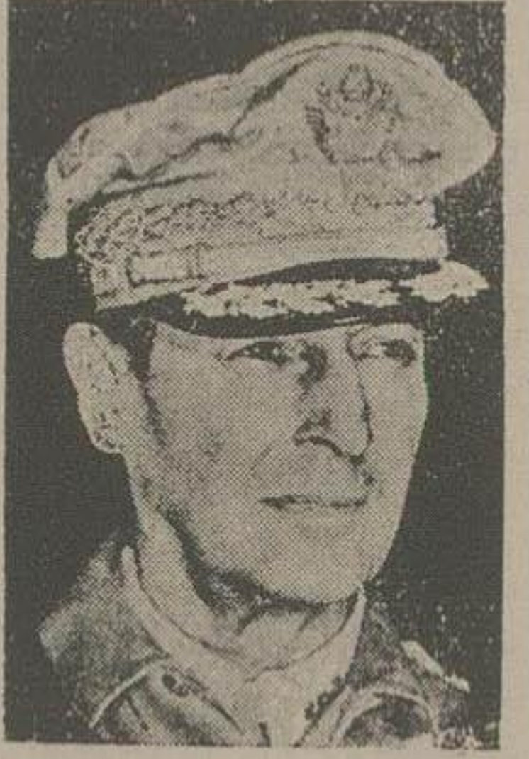
ژنرال مالک آرتور

واشنگتن - خبر کراوی فرانسه - چند روز دیگر پیمان صلح با ژاپن بین دولتی امریکا و ژاپن امضاء خواهد رسید و بلافاصله قسمت های مهم ارتش امریکا سه س از متار که جنگ بین المللی دوم تا کنون فرماندهی ژنرال دو گلاس مالک ارتور در آن سرزمین متوقف بوده اند به امریکا باز خواهند کشت.